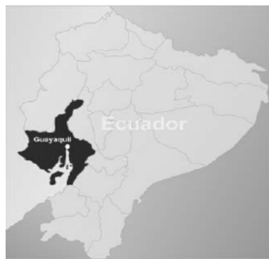
Figura 1. Ubicación de Puerto de Guayaquil

Es el único puerto del país que puede convertirse en el más eficiente del país, con menor inversión Excelente abrigo de la acción de corrientes, oleajes y vientos de mar abierto. Profundidad suficiente para el manejo de la carga. Con el dragado actual a mediano y largo plazo. Suficiente disponibilidad de espacios para la construcción de nuevos muelles y facilidades (Áreas de reserva Baja sensibilidad del manejo portuario respecto a fluctuaciones de la economía nacional. ). Especialización en tráfico y carga. Solvente situación financiera Ausencia de sindicatos. Prestación adecuada de servicios portuarios por la empresa privada. Baja interferencia en general con áreas urbanas Cercanía con el centro industrial más importante del país. Cercanía con una ciudad que empieza a funcionar como marca turística. Certificación en el Código Internacional de Seguridad para Buques e Instalaciones Portuarias PBIP - ISPS.