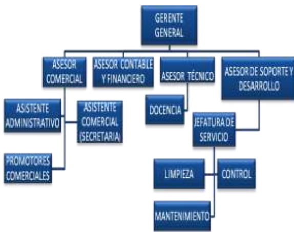
Figura 2. Organigrama de la Empresa

Debido a que ofrecemos un servicio educativo y en diversos horarios, necesariamente requerimos de personal altamente capacitado y numeroso a pesar de ser una empresa pequeña.