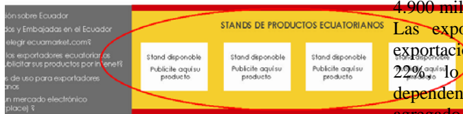
Figura 1. stand de productos ecuatorianos.

En esta sección de la página inicial del sitio estarán productos específicos que el exportador desee publicitar. Dando un clic en el stand, llevará al visitante a visualizar otra página en donde encontrará las especificaciones y fotos del producto que se está publicitando, así como los datos del exportador para el contacto.