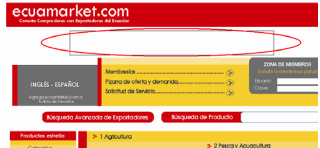
Figura 2. Banners

La medida de los banners es de 468x60 píxeles. Los banners estarán disponibles para su contratación ya sea mensual, trimestral, semestral o anual, y constituyen un medio de publicidad que direcciona electrónicamente al sitio Web del exportador, o al perfil del exportador dentro de Ecuamarket.com.