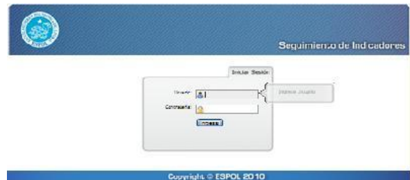
Figura 2. Pantalla de inicio del sistema

A continuación se muestran en la Figura 2 y 3, el resultado final una vez instalado el sitio: