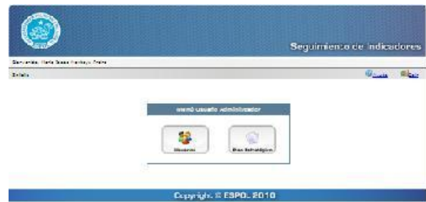
Figura 3. Ingreso a la administración del sistema