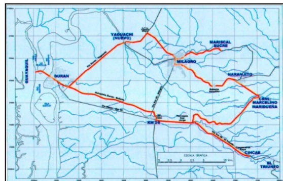
Figura 1. Mapa de la Ruta de la caña

Los tramos que incluye La Ruta de la Caña son: Guayaquil – Milagro – Mariscal Sucre – Marcelino Maridueña – Cincae – Guayaquil.