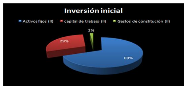
Gráfico 1. Inversión inicial

Después de conocer la inversión inicial necesaria a realizar y los flujos de efectivo proyectados a un periodo de 5 años.