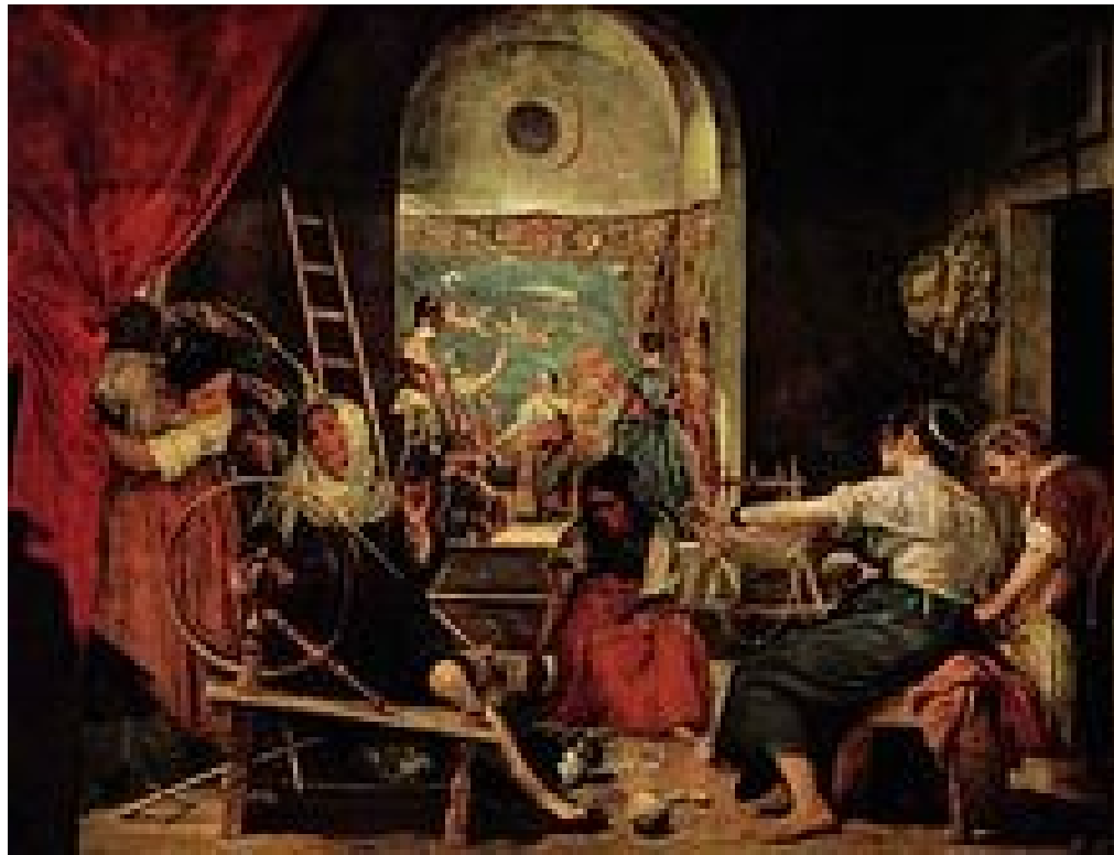
“Las Hilanderas”, Velásquez, Arte Barroco (s. XVII)

Aracne fue una gran tejedora mortal hija de un tintorero, que alardeó de ser más habilidosa que Minerva, diosa de la artesanía. La diosa ofendida organizó un concurso entre la dos en la que Minerva participa como anciana pero, según Ovidio, no pudo superar a Aracne. Además, el tema elegido por Aracne, los amores de los dioses, fue ofensivo, lo que hizo que Minerva la transformase en una araña. A Aracne se le atribuye el descubrimiento del hilo y las redes., y a su hijo del huso.