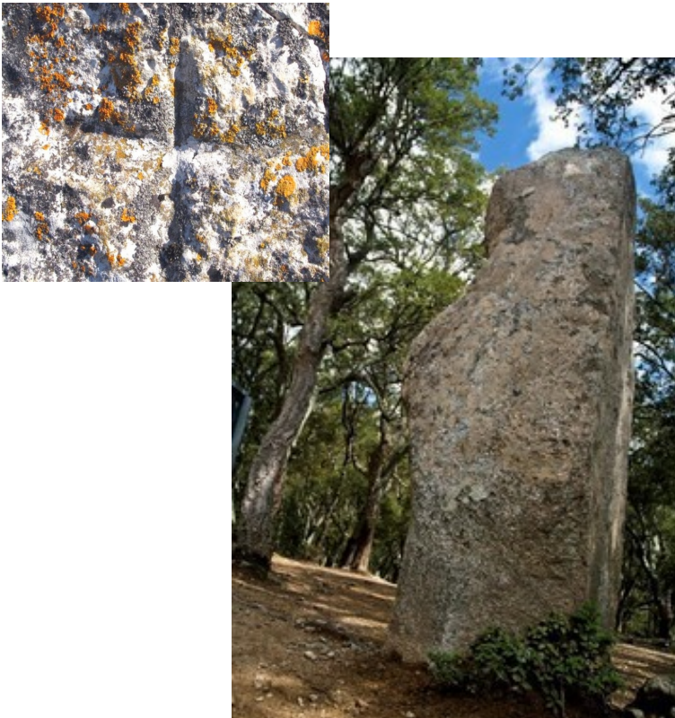
“La piedra del diablo”

2. En Europa hasta hace aproximadamente un siglo se pensaba que los menhires ( Arte Prehistórico, Neolítico ) habían sido levantados por demonios y por ello a muchos se los cristianizaba grabándoles una cruz. Esta leyenda es...: