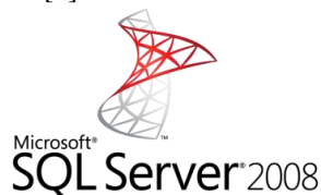
Figura 2. Gestor de Base de Datos

Una base de datos es un “almacén” que nos permite guardar grandes cantidades de información de forma organizada para que luego podamos encontrar y utilizar fácilmente [2].