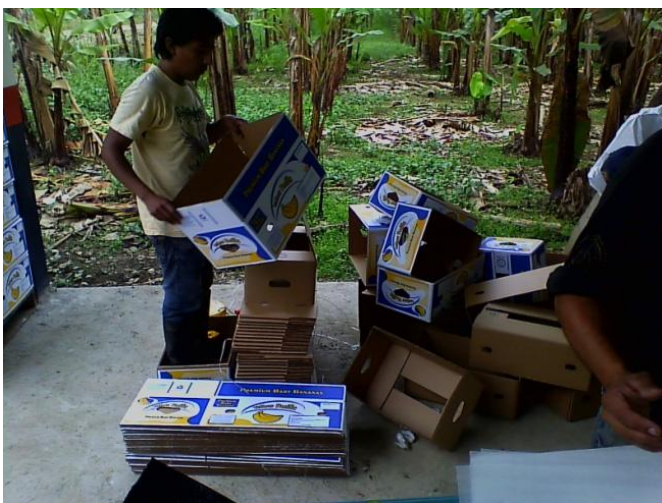
Figura 4.5. Cajas de reemplazo para corregir daños en empaque. Realizado por: L. Salau 2014