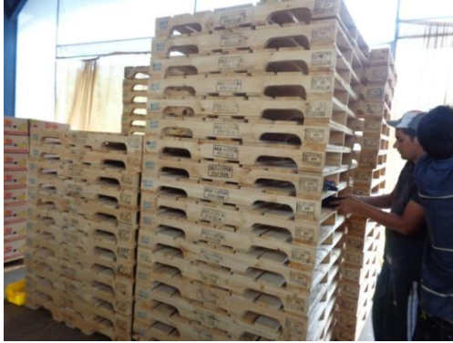
Selección de pallets