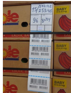
Etiquetado del pallet