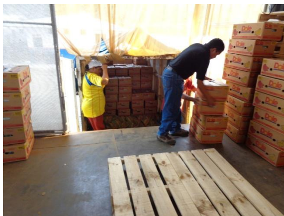
Figura 2.3. Arribo de cajas en el centro de acopio. Realizado por: L.

Las cajas son llevadas por el propio productor o por los compradores (o intermediarios) hacia centros de acopio, donde serán acumuladas para en lo posterior formar los pallets (Figura 2.3), que es la forma final en al cual serán exportadas hacia el mercado final [17].