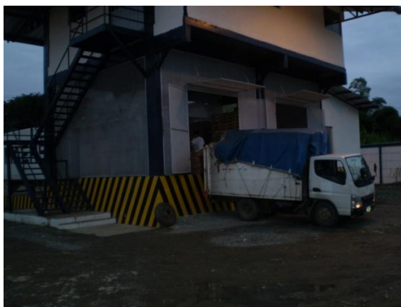
Figura 4.1. Centro de Acopio de Dole donde los productores evaluados llevan sus cajas.

Para esto, se realizaron las respectivas visitas a las fincas y al centro de acopio. Además, la evaluación en las fincas se desarrolló mediante una ficha comparativa, donde se verificó que las actividades en las fincas estén acordes a lo que exigen normas internacionales y nacionales (Apéndices 1, 2 y 3).