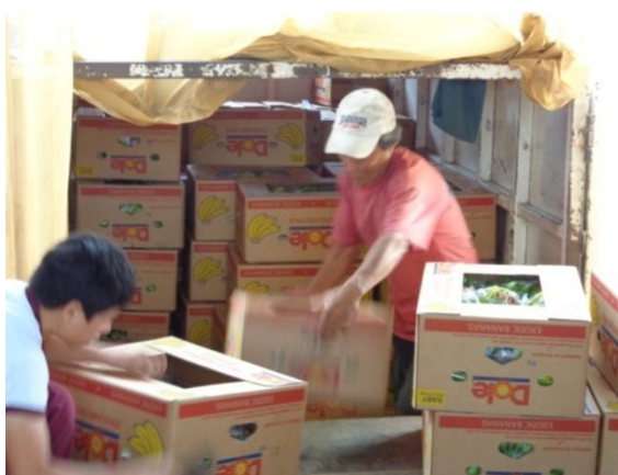
Figura 2.2. Productor subiendo sus cajas al camión para su transporte al centro de acopio. Realizado por: L. Salau 2014

Una vez empacada la fruta según las especificaciones dadas, las cajas son almacenadas en un vehículo de transporte destinado para tal fin (Figura 2.2), puede ser un camión de cajón de madera o un furgón exclusivo para este fin [10].