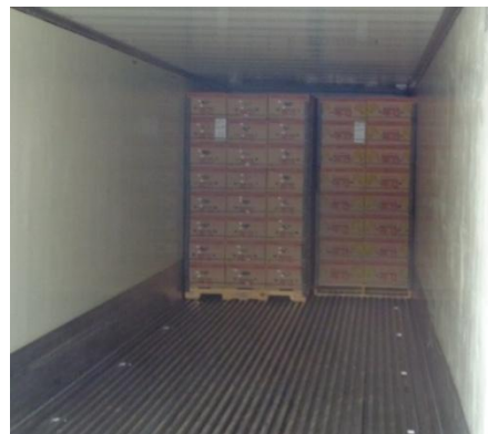
Pallets en el contenedor