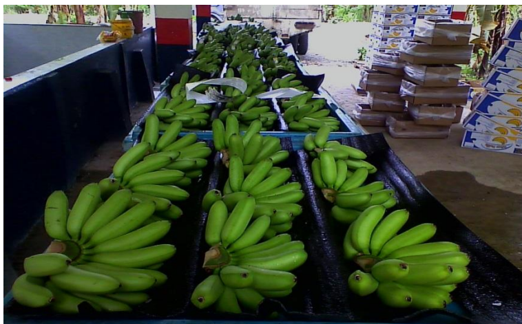
Figura 1.1. Gajos o Clúster de banano orito verde. Realizado por: L. Salau 2014

Generalmente se encuentran plantaciones de orito en diversos pisos climáticos, pudiendo hallarse el cultivo en zonas de 200 msnm hasta en lugares ubicados a los 1000 msnm o más; no obstante, por ser una fruta de origen tropical, no se desarrolla de igual manera a tales altitudes, presentándose retraso en el desarrollo vegetativo, en la floración, el llenado y al final la fruta madura mucho antes que pueda ser cosechada en el grado requerido [10].