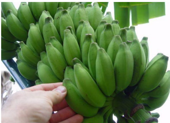
Figura 1.2. Racimo de banano manzano ( Musa balbisiana ).