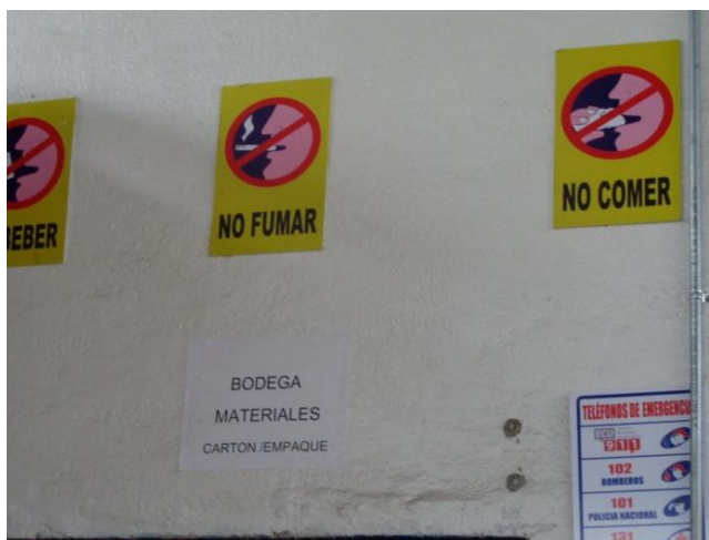
Figura 4.3. Prohibiciones dentro del centro de acopio. Realizado por: L. Salau 2014

También, es importante que en dicho lugar no pueda ingresar persona alguna que no haya sido autorizada por el encargado o Administrador, debido a que si esto ocurre, existe el peligro de que la fruta vaya a ser mal manipulada o pueda ser contaminada de alguna forma [25].