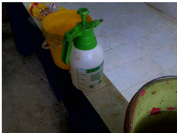
Figura 2.1. Materiales utilizados por productores de orito para fumigación. Realizado por: L. Salau 2014