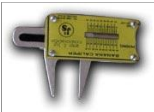
Figura 1.3. Calibrador utilizado para determinar grosor ideal de corte para banano.