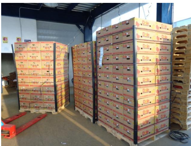
Figura 4.4. Pallets elaborados para exportación de la fruta a los mercados internacionales. Realizado por: L. Salau 2014

aunque esto último es algo muy raro de realizar, ya que si se rechaza una caja por calidad pésima, se asume el daño en todo su contenido.