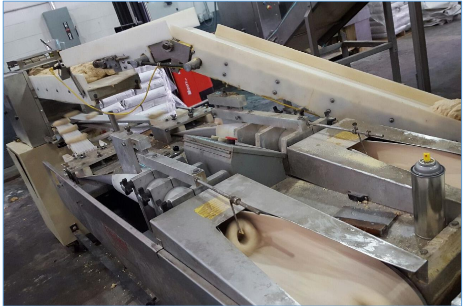
Figura 1.2 Cortado y formado de los bagels de ajonjolí