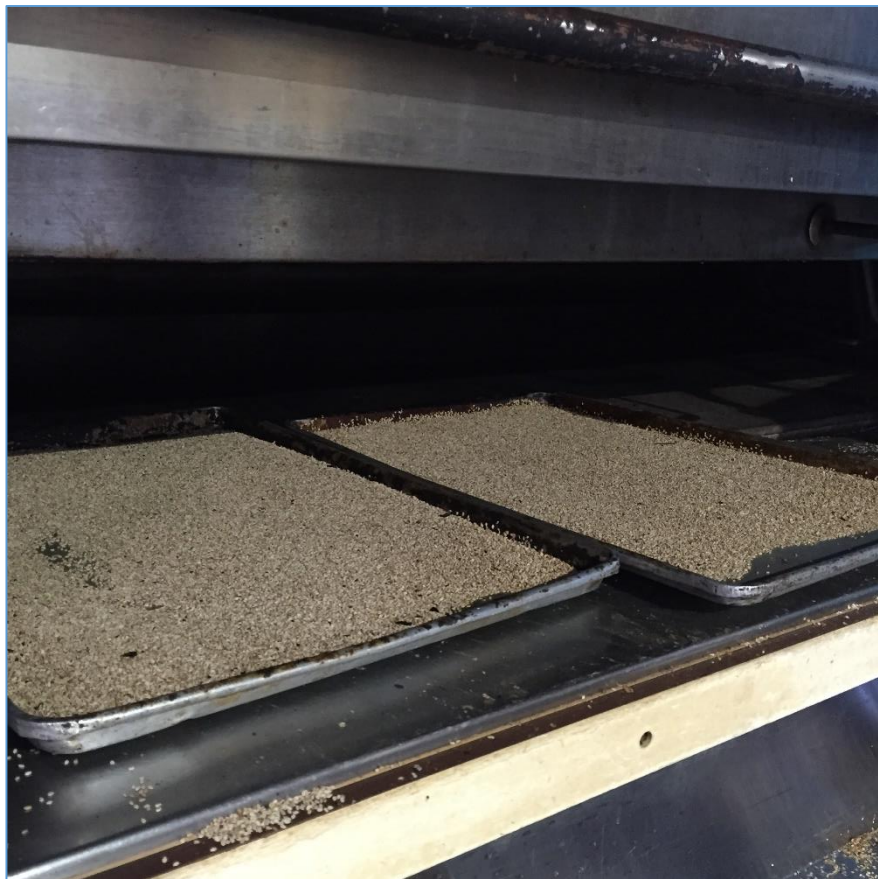
Figura 2.2 Secado de las semillas

Las semillas recolectadas son extendidas sobre bandejas de acero inoxidable y secadas en el horno a 150°C, cada 5 minutos son removidas para lograr un secado homogéneo, el tiempo total de secado es de 15 minutos (ver Figura 2.2).