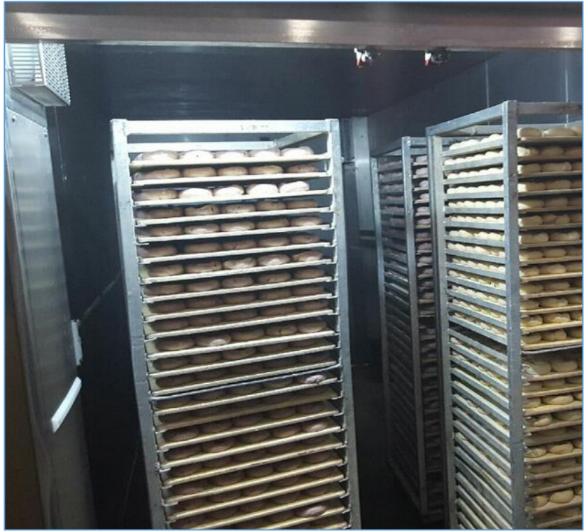
Figura 1.3 Carros con los bagels en la Cámara de Fermentación