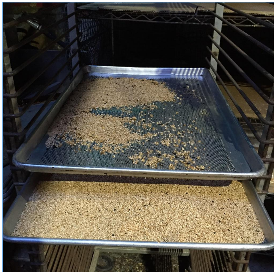
Figura 2.3 Tamizado de las semillas de ajonjolí

Las semillas son tamizadas manualmente con el propósito de separar cualquier objeto extraño que haya podido ser colectado durante este proceso (ver Figura 2.3).