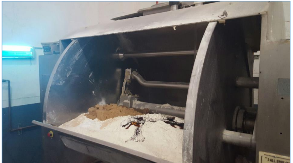
Figura 1.1 Mezcladora con los ingredientes para la elaboración de bagels de ajonjolí

Luego de pesar los ingredientes, estos son colocados en una mezcladora por 15 minutos a una velocidad constante, procediéndose a verificar cada 5 minutos la consistencia de la masa. Luego de este tiempo la masa presenta una consistencia uniforme y una textura elástica. La mezcladora tiene tres barras de mezclado que giran a 35 rpm en baja velocidad y a 70 rpm en alta velocidad, con un motor de 5 HP (ver Figura 1.1).