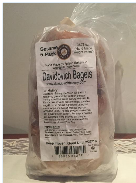
Figura 1.5 Bagels de Ajonjolí

Para ser empacado los bagels, estos deben llegar a la temperatura de 32°C para evitar que se aplasten o deformen en el empaque. Las fundas utilizadas son de polietileno de baja densidad y para finalizar se le colocará una etiqueta para su identificación. La presentación final es de 5 bagels de ajonjolí por funda y el tiempo de empacado por funda es de 2 minutos (ver Figura 1.5).