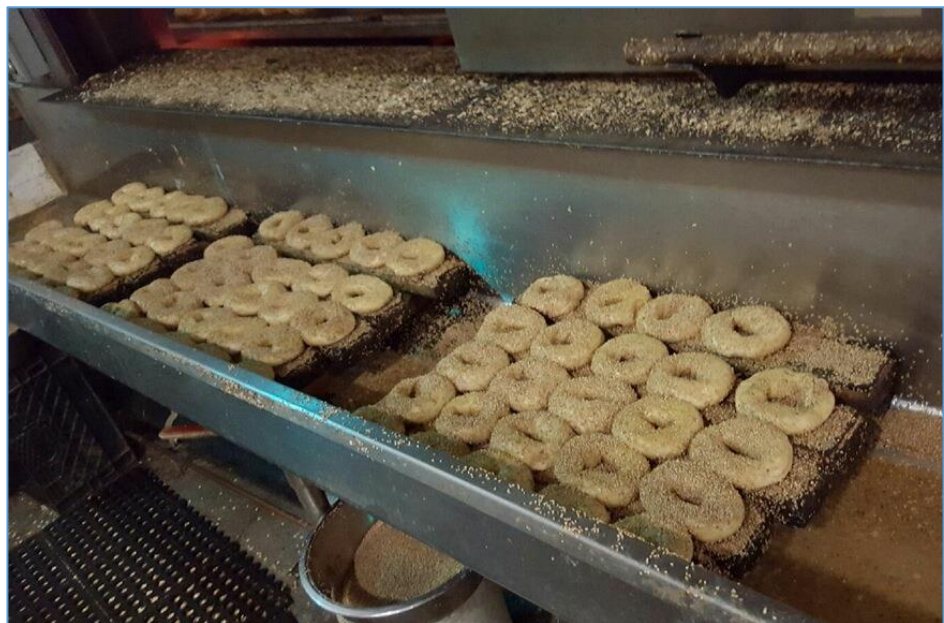
Figura 2.1 Recolección de las semillas de ajonjolí

Las semillas que no se adhirieron a los bagels son recolectadas por medio de la plancha de acero inoxidable a la entrada del horno, se utiliza un chorro de agua a presión para ser barridas al centro de la plancha y caigan por el orificio de drenaje a un colador metálico con una capacidad de 18 Kg que retiene las semillas y deja pasar el agua (ver Figura 2.1).