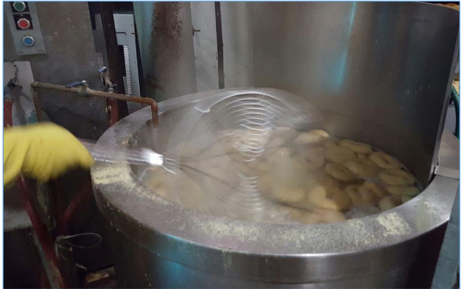
Figura 1.4 Escaldado de los bagels