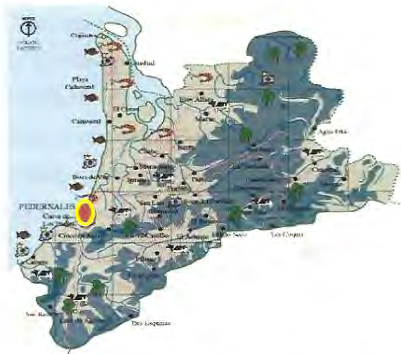
FIGURA 1: Ubicación Geográfica del Cantón Pedernales