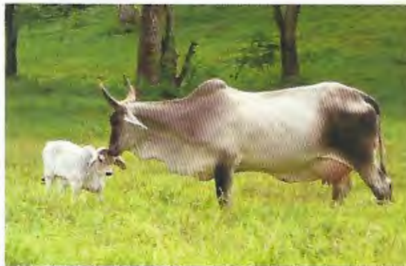
Alimentación del ganado con pasto