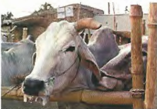
La fiebre aftosa