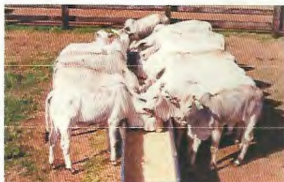
Alimentación mineral del ganado