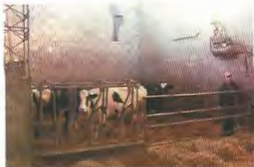
Características del lugar del parto