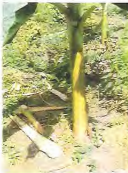
Foto: 28 Eliminación de yaguas secas

2.1.7 Deschante.- Es la limpieza de yaguas secas adheridas al seudotallo. (ver foto 28)