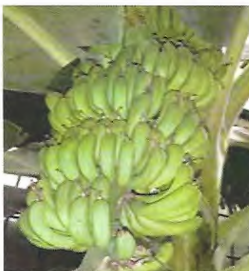
Foto: 1 Racimo de banano orgánico