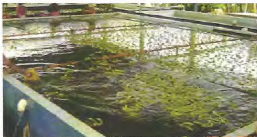
Foto: 41 Lavado de la fruta para limpiar el látex emitido luego del desflore.

en más de dos dedos. (ver.foto 40). Cualquier desperfecto de la corona se arregla usando cuchillos curvos bien afilados.