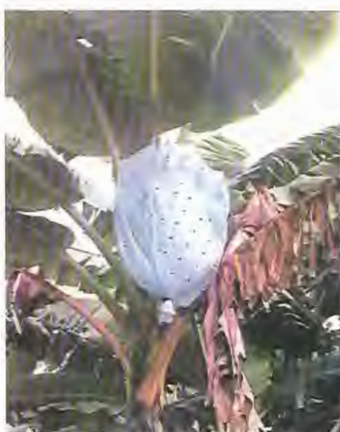
Foto: 31 Racimo Enfundado

Para lograr frutos sanos y con calidad de exportación, que serán exportados se debe realizar una serie de labores, para proteger el racimo y los frutos, de los cuales detallamos lo siguiente: