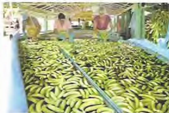
Foto: 40 Lavando y saneando manos

2.3.3 Desmane: El desmane se lo realiza con un cuchillo curvo o cortador semicircular, (cuchareta) efectuando un solo corte limpio sin dejar otros cortes ni desgarres. El corte se lo realiza lo más cerca posible al tallo dejando suficiente corona, las manos son colocadas cuidadosamente en el tanque de desmane. (ver foto 39).