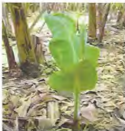
Foto: 25 Hijo de agua o hijo no verdadero, improductivo.

2.1.4 Los hijos de agua.- Son los que desarrollan hojas anchas a muy temprana edad debido a deficiencias nutricionales. Siempre deben ser eliminados y se utilizan cuando hay un solo hijo de espada. (ver foto 25)