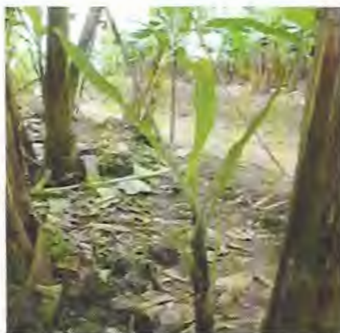
Foto: 24 Hijo de espada o cola de burro, Considerado como hijo verdadero, productivo.

En una planta de banano hay tres clases de hijos: hijo de espada, hijo de agua e hijo de rebrote.