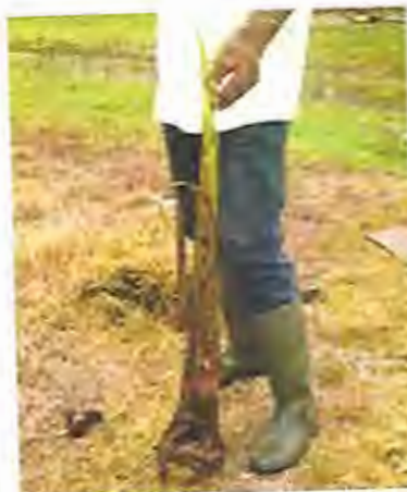
Foto: 6 Colino para la regeneración

1.3.4 Resiembra.- Usar preferiblemente hijuelos tipo puyón los cuales se pueden separar de la planta madre y sembrarse sin necesidad de cortar las raíces ni sus pseudotallos. ( ver foto 6)