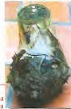
Calidad y tamaño ideal de la cepa para la siembra