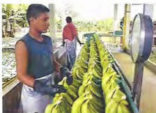
Foto: 42 Pesando los clusters

2.3.5 Enjuague o desleche.- Las manos o los clusters permanecen dentro del agua en el tanque, por un lapso de entre doce a veinte minutos para eliminar todo el "látex o leche". (ver foto 41).