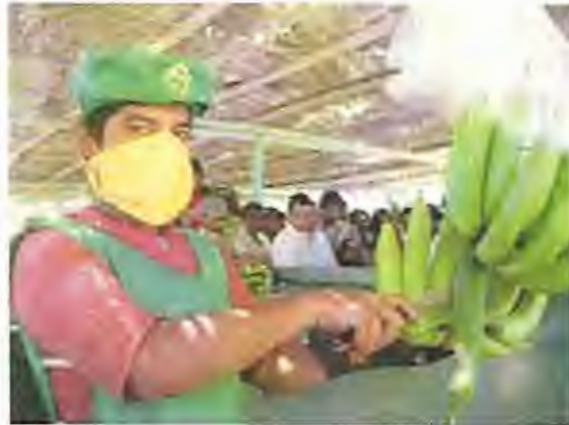
Foto: 39 Realizando el Desmane

2.3.3 Desmane: El desmane se lo realiza con un cuchillo curvo o cortador semicircular, (cuchareta) efectuando un solo corte limpio sin dejar otros cortes ni desgarres. El corte se lo realiza lo más cerca posible al tallo dejando suficiente corona, las manos son colocadas cuidadosamente en el tanque de desmane. (ver foto 39).