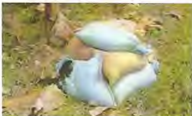
Foto: 29 Productos orgánicos aplicados al Cultivo de banano como fuentes de abonamiento.

2.1.8 Fertilización.- En la Producción bruta de 50 TM. de fruta, la planta extrae 300 unidades de Nitrógeno, 100 unidades de R2O5 y 600 Unidades de K2O, teniendo en cuenta que nuestros saludos continúen cantidades permisibles en los dos últimos nutrientes, previo análisis de suelos.