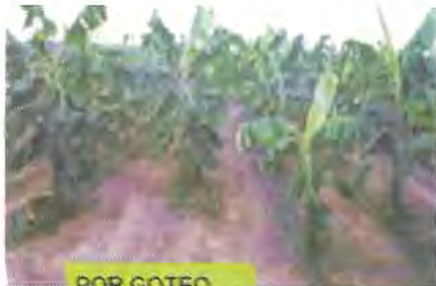
Foto: 7 Riego por goteo