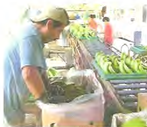
Foto: 45 Colocándolo los clusters en la caja

Para ciertos mercados, algunas compañías exportadoras colocan en los dedos interiores de la mano o del clusters unas etiquetas distintivas de la marca registrada. (ver foto 44).