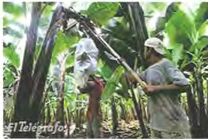
Foto: 36 Picando el pseudotallo

Para el transporte de la fruta desde la plantación hasta la planta de procesamiento se requiere, según el tamaño de la plantación, de cuadrillas compuestas de: un ayudante, que es la persona que calibra el racimo, retira los puntales o soportes y deshoja la planta, un cortador y los cargadores y arrumadores.