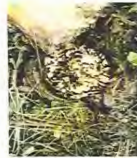
Foto: 13 Daño producido por el picudo

1.6.3 Gorgojo Negro del Plátano.- ( Cosmopolites sordidus ), de adulto es un gorgojo de color negro, (ver foto 12), de unos 13 mm. y cabeza con la prolongación del rostro característico de la especie considerado esta como la mayor plaga del banano en toda las zonas del mundo. El insecto adulto es de color negro uniforme y finos surcos en los élitros, el daño lo hace en el rizoma.(ver foto 13).