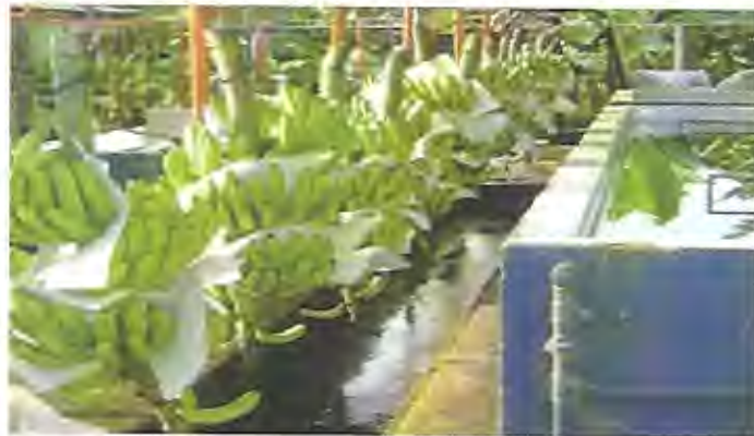
Foto: 38 Desflore en el patio de empaque, antes de iniciar el desmane.

2.3.2 Desflore: Es la eliminación de las flores secas que se encuentran en la punta de los frutos del racimo que va a ser desmanado; (ver foto 38), se comienza por la mano inferior, sin utilizar ni trapos ni polietileno, únicamente con los dedos.