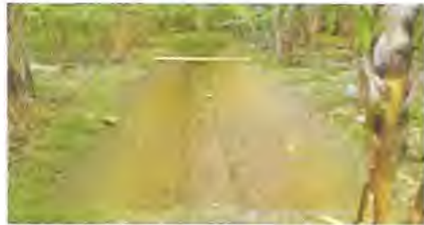
Foto: 10 Forma de mantenimiento de un canal de drenaje www.google.com.ec/search .

Sangrías.- Son drenes superficiales de 40 a 50 cm de profundidad que sirven para evacuar las aguas superficiales estancadas.