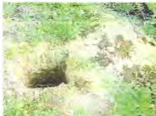
Foto: 4 Sistema de hoyado y tamaño del hueco www.corniza.org.co

Al cormo elegido se le debe cortar las raíces y partes delseudotallo, dejándole unos 15 a 20 cm de éste, eliminando aquellos atacados por nemátodes o picudo. (ver foto 3). Así mismo, un tratamiento de inmersión de los cormos en agua calentada a temperaturas constantes entre 53 o C a 60 o C durante 5 a 10 minutos, sirve para limpiar los parásitos que contenga la semilla seleccionada. Cualquier clase de cormo con yemas vegetativas sanas y sin galerías o perforaciones puede servir como semilla.