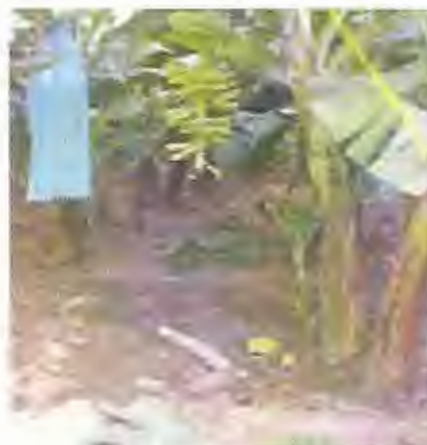
Foto: 34 Eliminación de flor masculina

2.2.5 Destore.- Es la eliminación de la flor masculina (deschira), la época apropiada para ejecutar esta labor es 2 semanas de la formación del racimo, lo que genera un estímulo de precocidad y desarrollo de los frutos. (ver foto 34).