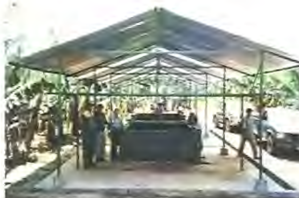
Foto: 37 Empacadora de Banano Orgánico

Todo el proceso se lo realiza en las empacadoras que son instalaciones o construcciones especialmente diseñadas para este efecto y que puedan ser de diferente materiales y dimensiones dependiendo sobre todo de factores como: disponibilidad económica, disponibilidad de materiales, tamaño de la plantación. (ver foto 37).