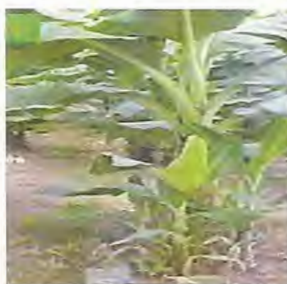
Foto: 26 Rebrotos

2.1.4 Los hijos de agua.- Son los que desarrollan hojas anchas a muy temprana edad debido a deficiencias nutricionales. Siempre deben ser eliminados y se utilizan cuando hay un solo hijo de espada. (ver foto 25)