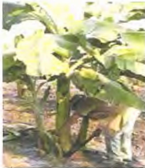
Foto: 23 Seleccionando hijuelos

materiales son provenientes primero de los deshojes y deshijos y luego de plantas ya cosechadas.