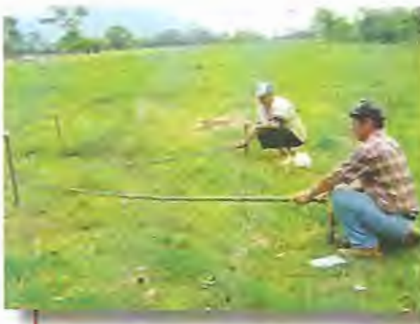
Sistema de trazado en triángulo

Se debe mencionar que estas medidas dependen del tamaño de la semilla.