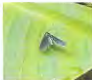
Foto: 15 Gusano peludo de la Hoja ( Ceramidia sp) www.bananas.bioversityinternational.org

Son insectos defoliadores que se encuentran dentro de una plantación bananera, entre éstos mencionaremos las más comunes: