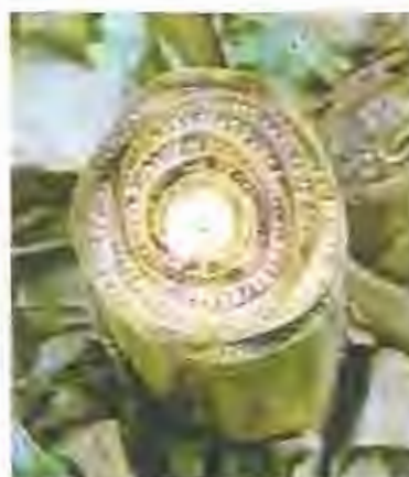
Foto: 21 Pseudotallo con Mal de Panamá

1.8.3 Mal de Panamá.- Es una enfermedad causada por un hongo conocido como Fusarium oxysporum cubense . (ver foto 20). Se inicia cuando las raicillas son infectadas por el hongo que luego invade una raíz principal y asciende al pseudotallo a través del sistema vascular. Una vez establecida en el rizoma, la enfermedad se desarrolla rápidamente y se propaga a través de los haces vasculares tiñéndolos de color marrón, rojo oscuro o púrpura. Inmediatamente aparecen los síntomas en las hojas, las mismas que comienzan a marchitarse desde la base de los pecíolos y en las partes inferiores de las nervaduras centrales, las láminas foliares cuelgan hacia abajo tomando una coloración blanquecina. En ocasiones todas las hojas, salvo las más jóvenes, se abaten de éste modo y solo queda en postura recta la hoja del corazón o "bandera". Todas las hojas nuevas tienen un color amarillento moteado y presentan deformaciones y