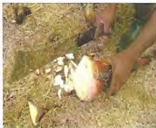
Foto: 3 Preparando la semilla

Existen tres tipos de cepas o material de propagación, las mismas que deben seleccionarse de plantaciones sanas: cepas de plantas maduras; cepas de plantas no maduras (que son consideradas las más apropiadas) y cepas de hijos de espada. (ver foto 2).