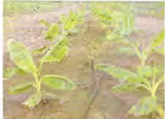
Foto: 8 Riego por micro aspersión Con una línea lateral