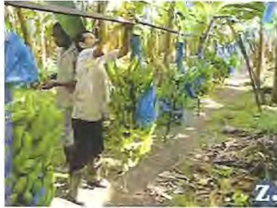
Foto: 35 Cable vía y proceso

El banano se cosecha cuando está verde, (ver foto 35). El estado de desarrollo en que se cosecha se conoce como "grado".