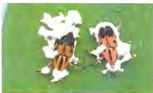
Foto: 11 Metamasius hemiterus , mostrando alta susceptibilidad al hongo.

Existe una serie de plagas pero por la magnitud de los daños mencionaremos las siguientes: