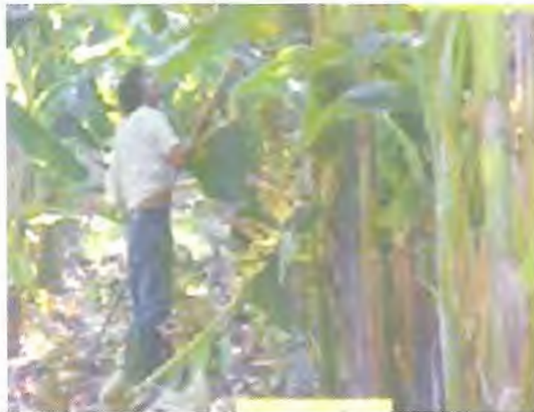
Foto: 27 Eliminando hojas dobladas y secas

Cuando se realiza el deshoje los cortes con machetes deben hacerse lo más profundo posible tratando de eliminar la yema de crecimiento del hijo evitando el rebrote; el corte se dirige de adentro hacia afuera para no herir a la madre, luego se procede a cubrir la parte cortada.