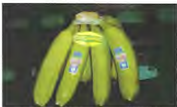
Foto: 44 Etiquetado de la fruta con el sello de orgánico

Este producto tiene acción fungicida, bactericida y viricida, es un extracto de semillas de cítricos mezclado con ácidos orgánicos, principalmente ácido ascórbico, tocoferoles, azúcares, ácido cítrico, ácido láctico, entre otros; los cuales ayudan a prolongar la vida útil de la fruta.