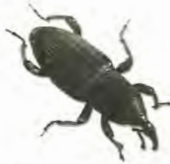
Foto: 12 Picudo negro

muere, la muerte puede ocurrir de los 5 a 8 días, dependiendo de la infección del hongo y estadio del insecto. (ver foto 11).