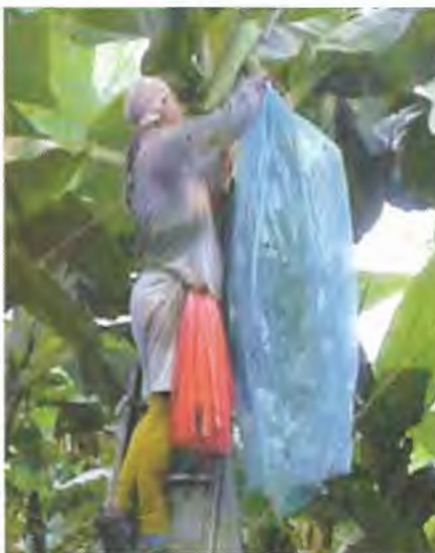
Foto: 33 Colocando la cinta

2.2.3 Deschive.- Se realiza a las 2 semanas de nacida la bellota o Cucula. Consiste en podar del racimo la última mano o mano falsa, dejando dos dedos adheridos al raquis, incluyendo la eliminación de 2 manos inmediatas superior de la mano falsa. (ver foto 32). Con esta labor se han obtenido resultados positivos en aumento de grado y/o peso de los dedos y mejoras en apariencia y calidad de la fruta.