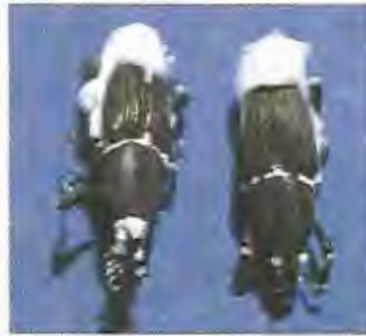
Foto: 14 Picudo infectado con B. bassiana www.bananas.bioversityinternational.org