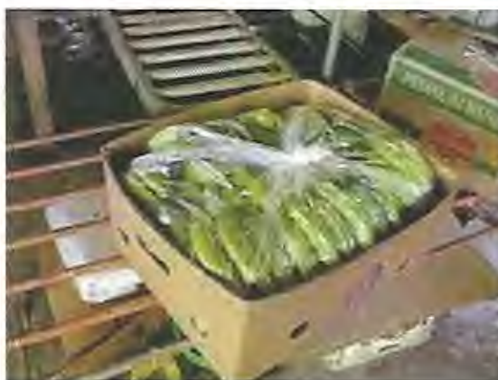
Foto: 46 Caja lista para ser tapada

2.4.1 Empaque: Se lo realiza en cajas de cartón corrugado elaboradas bajo especificaciones y dimensiones establecidas según el peso a empacarse, la distancia a la que va a ser transportada la fruta y las condiciones del mercado consumidor. (ver foto 45).