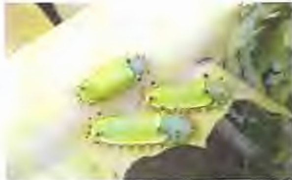
Foto: 16 Gusano Monturita (Sibine spp) www.bananas.bioversityinternational.org

1.7.1 Ceramidia.- La ceramidia se alimenta en el envés de la hoja, dejando perforaciones paralelas a las venas foliares.(ver foto 15). Cuando salen los huevecillos el daño por debajo de la hoja es una raspadura leve, pero conforme avanza los agujeros se perforan completamente.