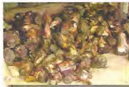
Tipo de semilla de plátano para la siembra