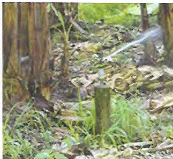
Foto: 9 Aplicación de agua por Riego subfoliar www.monografias.com