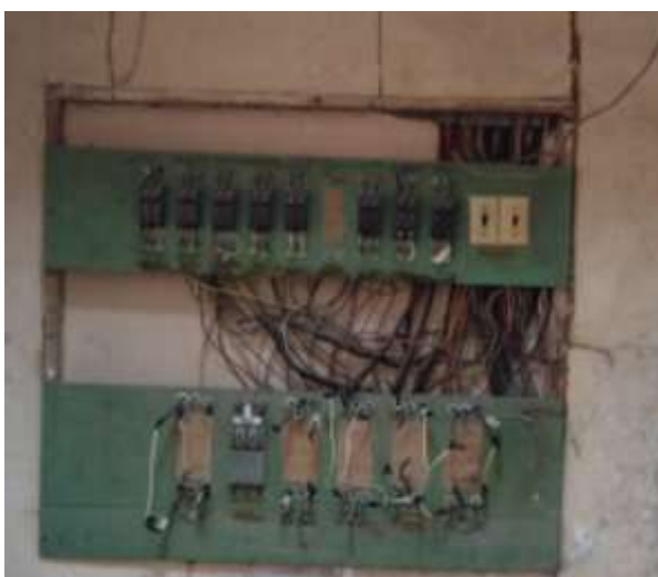
Figura #2 Panel de Disyuntores PB-AD

Panel de Disyuntores de la planta baja ala derecha, ubicado frente al laboratorio de morfología, el cual provee de energía a toda el ala derecha de la planta baja.