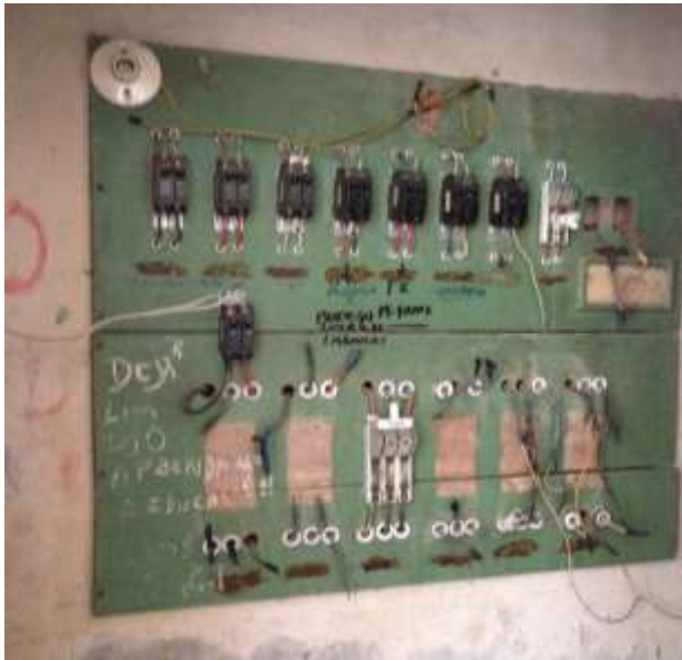
Figura # 3 Panel de disyuntores PA-AI

Panel de Disyuntores de la planta alta ala izquierda, ubicado frente al aula 202, el cual provee de energía a toda el ala izquierda de la planta alta 1.