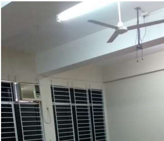
Figura #4 Iluminación y Climatización

Estado actual de las aulas en el edificio Rizzo, no funciona el aire acondicionado, el cableado para el proyector no funciona y hay que mejorar la iluminación de las mismas