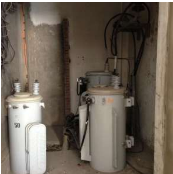
Figura #1: Transformadores

Transformadores monofásicos de 250 KVA y 100 KVA, ubicados en el cuarto de transformador a la entrada del edificio Rizzo, el mismo que alimenta un tablero principal de distribución, que se encuentra en el cuarto junto al de transformadores.