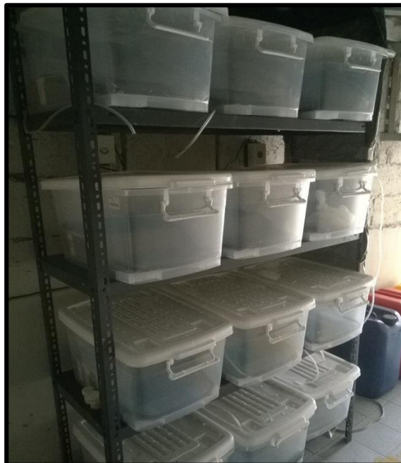
Figura 2. Recipientes utilizados para mantener a los cangrejos rojos en cautiverio.

Para la preparación de los medios se utilizó agua de mar filtrada a 35ups. Las diluciones se hicieron con agua potable previamente desclorinada con Tiosulfato de sodio (Na 2 S 2 O 3 ). Se hicieron recambios de agua del 100% dos veces por semana.