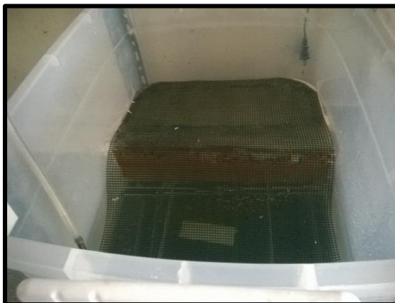
Figura 2. Diseño del interior del recipiente dividido en una parte seca y húmeda para mantener cangrejos rojos en cautiverio.