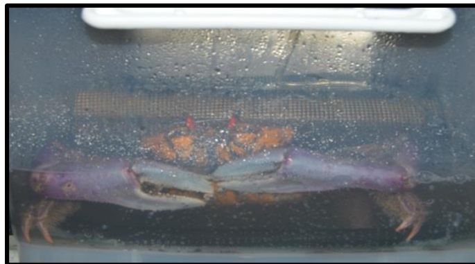
Figura 1. Ucides occidentalis en periodo de aclimatación.

Los cangrejos fueron aclimatados durante 7 días a una salinidad de 25 ups tomando en referencia la salinidad del estero al momento en que se capturaron. Se mantuvo a los cangrejos bajo un fotoperiodo natural. El proceso de aclimatación se monitorizó mediante la medición diaria de oxígeno con un valor promedio y desviación estándar de 6,35 \pm 0,37\text{mg/l} y temperatura del agua 27 \pm 0,12\text{C}^\circ , además se registró el comportamiento de animales.