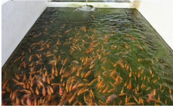
Figura 2. Juveniles de 4 gr aproximadamente en tanque previo al despacho.

Los juveniles de tilapia fueron transferidos a piscinas de producción a los 69 días post eclosión con un peso de 4.77 gr (Figura 2).