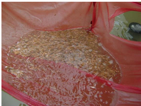
Figura 1. Recolección de alevines en tanque de reproductores.

Una vez desinfectados los alevines se trasladaron a un tanque de larvicultura en nuestro caso usamos un tanque circular de 1 m 3 de capacidad máxima que contiene agua preparada y limpia a 7 ppt para recibir los alevines.