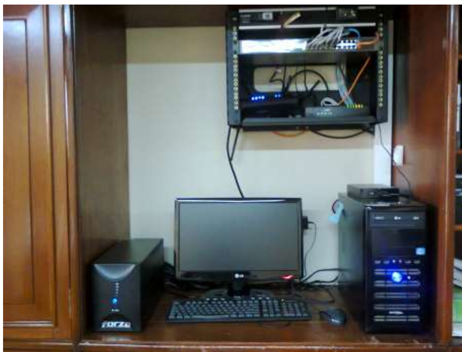
Figura 2.1: Servidor e instalaciones de red

La siguiente figura muestra la disposición del servidor con un disco duro externo de respaldo, su respectiva unidad de suministro eléctrico (UPS) en caso de interrupción de la energía eléctrica, el rack con su bandeja para equipos de comunicación, switch y patch panel de 24 puertos, ruoter y cable modem. Ver Figura 2.1