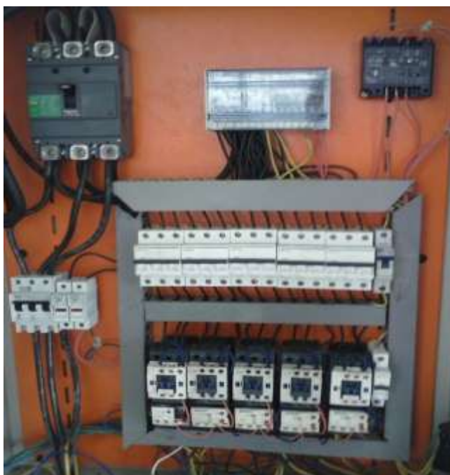
Figura 2.1: Tablero de Control (vista interna)