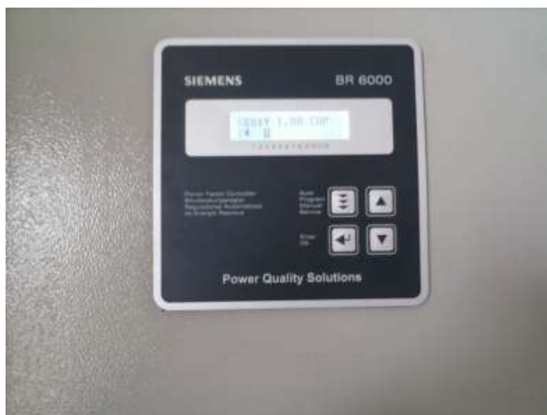
Figura 2.4: Regulador de factor de potencia SIEMENS BR 6000

Podemos observar el diagrama de conexiones que se encuentra en la parte trasera del regulador el cual se utilizó para realizar el cableado del banco de condensadores, ver Figura 1.5.