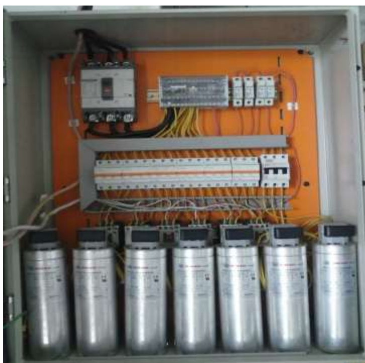
Figura 2.6: Banco de Condensadores (vista interna)

Por último se procedió a probar el banco de forma manual, es decir activando todos los pasos por medio del regulador para obtener datos como amperaje máximo, voltaje de operación y comprobar si no hay puntos calientes por conexiones flojas en los contactores o en los condensadores, dejando al banco de condensadores en óptimas condiciones de trabajo.