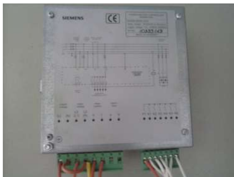
Figura 2.5: Diagrama de Conexiones del Banco

Podemos observar el diagrama de conexiones que se encuentra en la parte trasera del regulador el cual se utilizó para realizar el cableado del banco de condensadores, ver Figura 1.5.