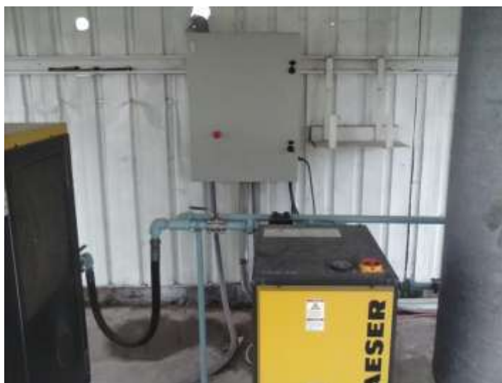
Figura 2.2: Tablero de Control (vista externa)

Luego de conectar todos los elementos se realizó una prueba en vacío para confirmar que el supervisor de fase no tenga conectado una fase invertida y bloquee la señal al circuito de control.