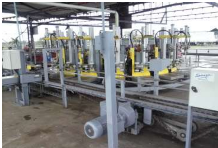
Figura 2.3: Envasadora Automática de GLP