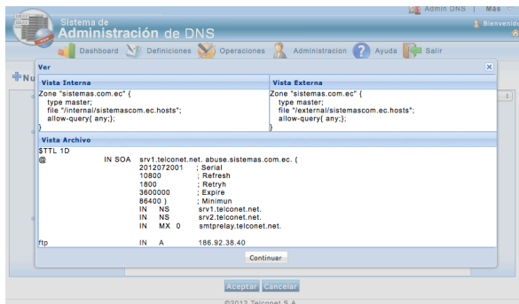
Figura 4. Ver Zona o Dominio

Una vez que se ha configurado la zona o dominio en los servidores DNS y grabado la información correspondiente en la base de datos, el aplicativo muestra el resultado de la configuración, tal como la figura 4.