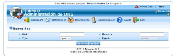
Figura 5. Creación de archivos reversos

En la figura 5 se muestran los campos necesarios para crear los archivos reversos.