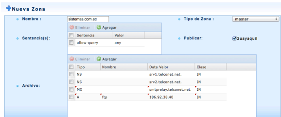
Figura 3. Nueva Zona o Dominio

Adicionalmente el usuario ya no debe conectarse a los servidores DNS mediante la consola, ya que el aplicativo ejecuta un script en JAVA que se conecta a cada servidor y realiza las acciones solicitadas. Ver figura 3.