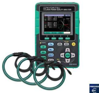
Figura 1. KYORITSU MODELO 6310.

El equipo analizador de energía es marca Kyoritsu y sus especificaciones se detallan en la Tabla 1.