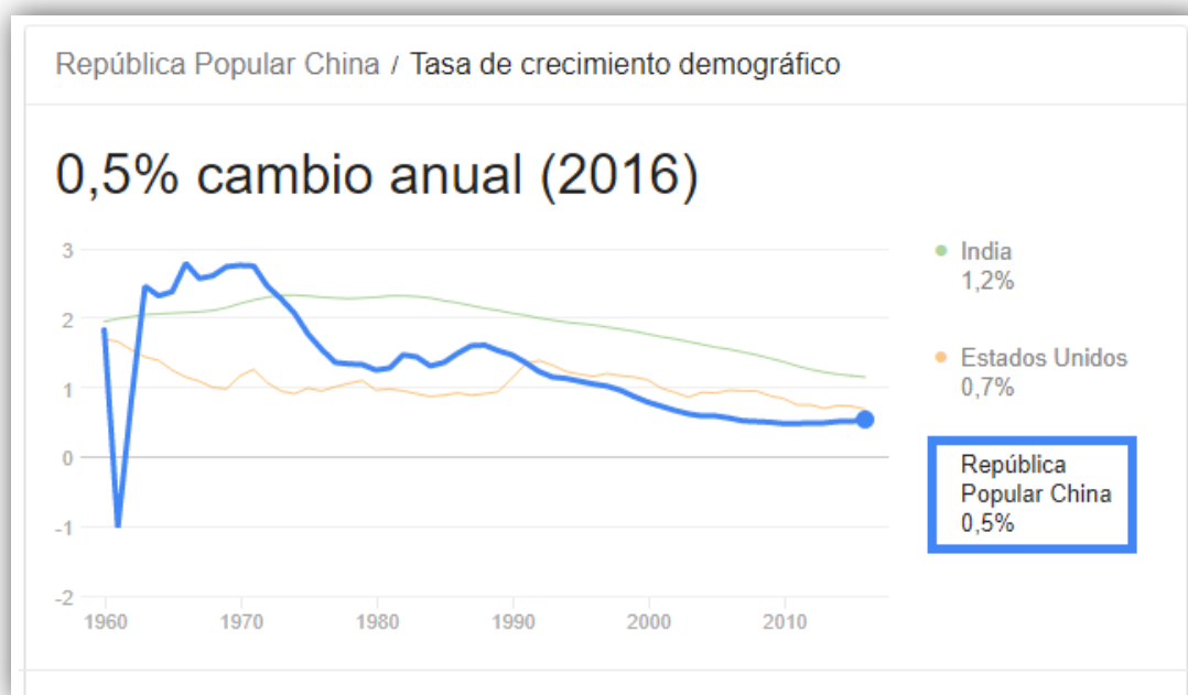
Figura 2: Tasa de crecimiento demográfico de China (Banco Mundial , 2017)

Estas reformas comerciales llevaron a mejoras no solo en términos económicos sino también sociales, ya que en el periodo comprendido entre el año de 1980 y 2010, la tasa de pobreza (ajustada a la paridad del poder de compra e inflación) se redujo del 80% al 10%, si se habla en términos de personas, aproximadamente 500 millones de habitantes salieron de la pobreza.