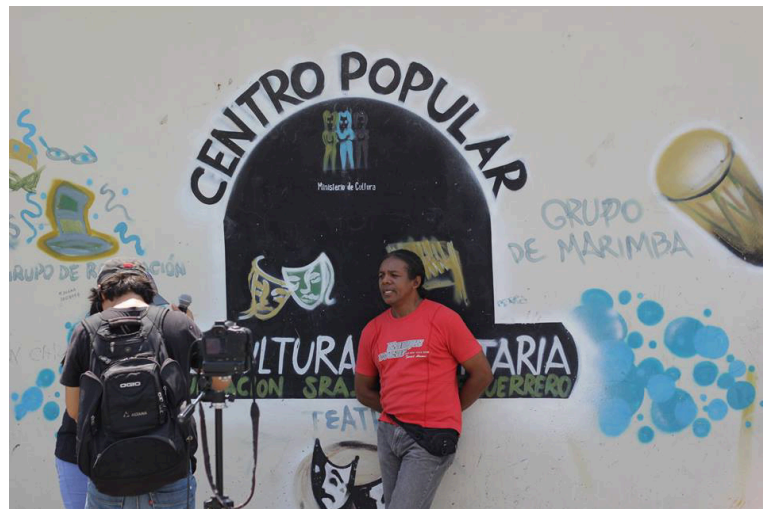
Figura 3 Centro cultural comunitario