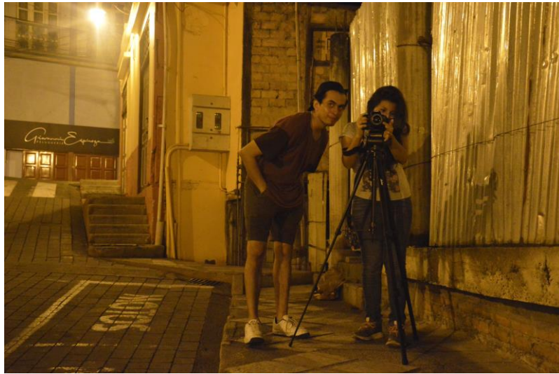
Figura 2.1 Detrás de cámaras