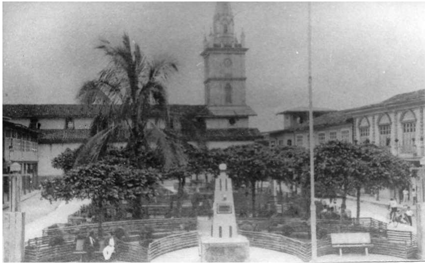
Figura 1.1 Foto antigua de Parque Central