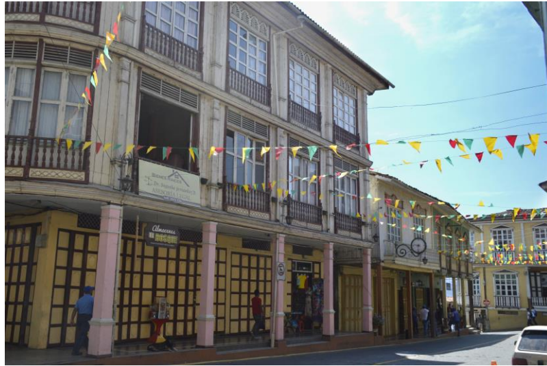
Figura 1.3 Casas de Zaruma