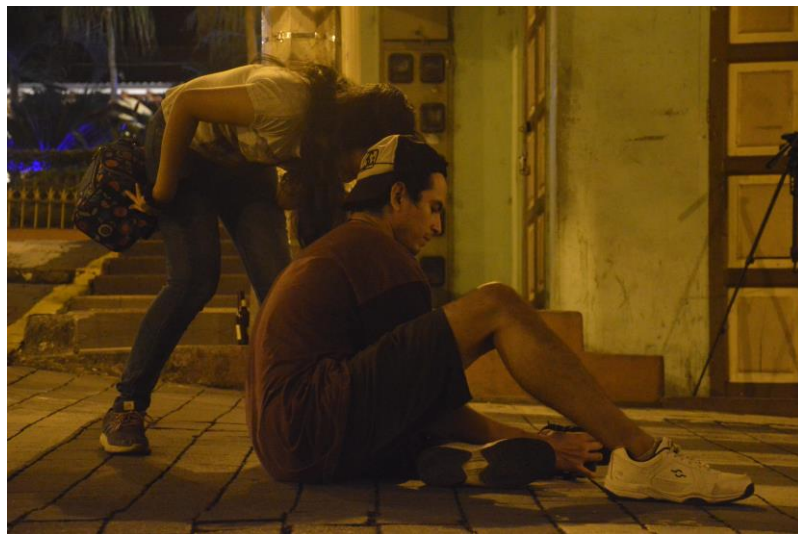
Figura 2.2 Detrás de cámaras