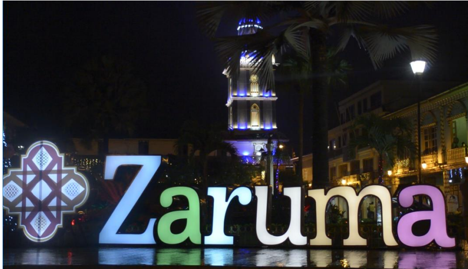
Figura 1.2 Zaruma Patrimonio Cultural

para aquellos que lo reciben. Es algo que hay que cuidar y preservar (ELKIN, 2017).