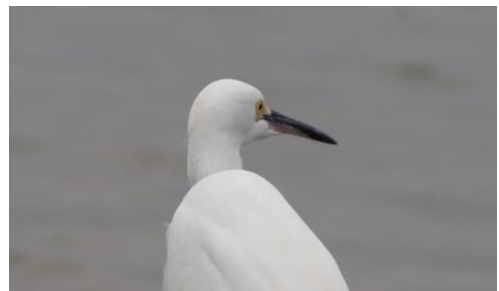
Imagen 4 Detalle de fotograma en Primer Plano utilizado dentro del audiovisual