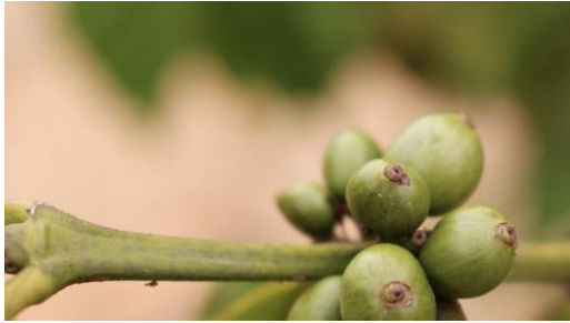
Imagen 1 Plano detalle usado dentro del producto final