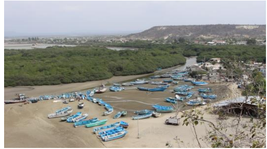
Imagen 2 Fotograma extraído del producto audiovisual que muestra un plano general