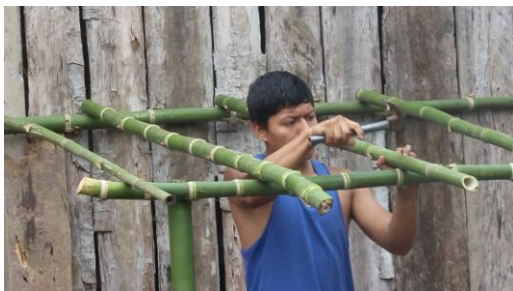
Imagen 3 Plano medio utilizado dentro de la grabación de la población Dos Mangas.