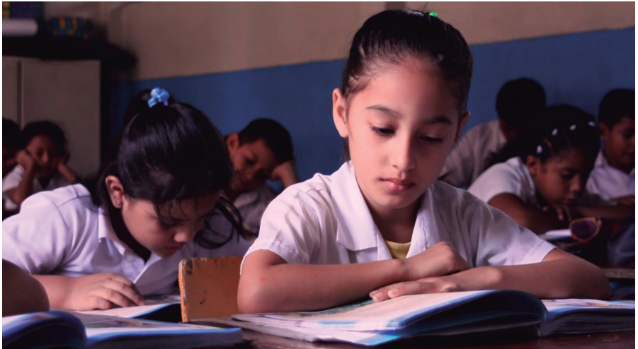
Escuela "María Barquet de Isaías"