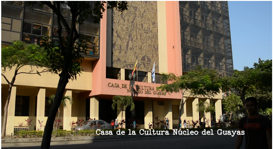
Casa de la Cultura - Núcleo del Guayas

Para el rodaje de este documental se entrevistó a personajes que se dedican a incrementar la cifra de niños y niñas lectores, ya sea a través de programas públicos, desde las escuelas públicas o privadas, como autoras o como padres de familia. Estas conversaciones se llevaron a cabo en sus lugares de trabajo, en sus librerías y bibliotecas personales. A continuación, se presentarán las locaciones en las que se grabaron las escenas del audiovisual: