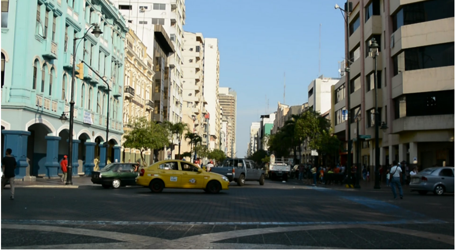
Avenida 9 de Octubre - Centro de Guayaquil