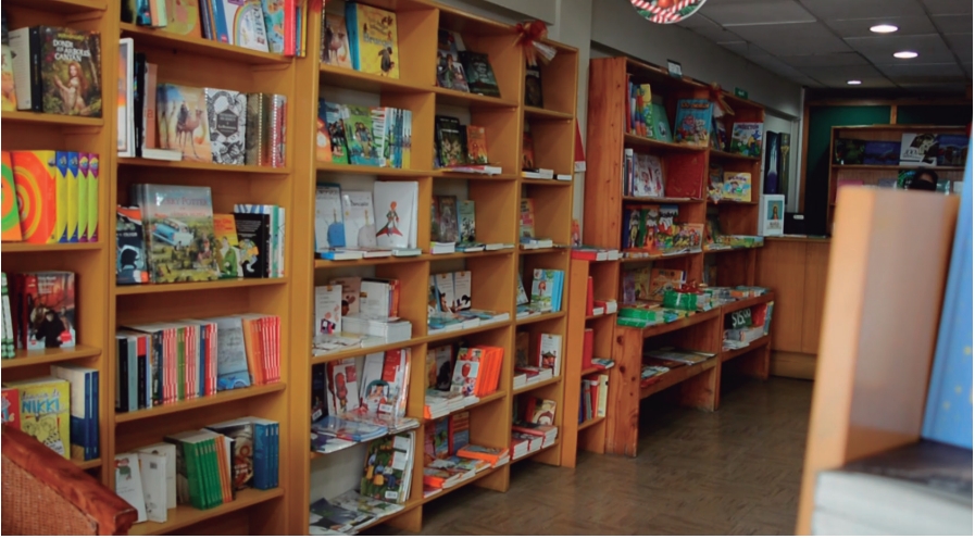
Librería "Vida Nueva"