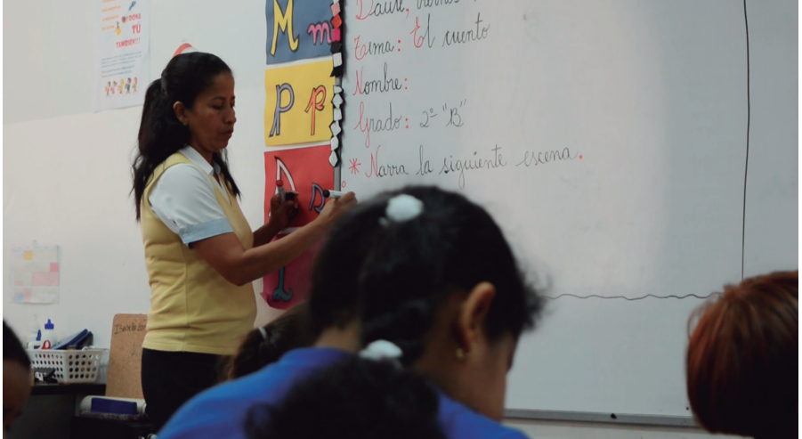
Unidad Educativa "Educamundo"