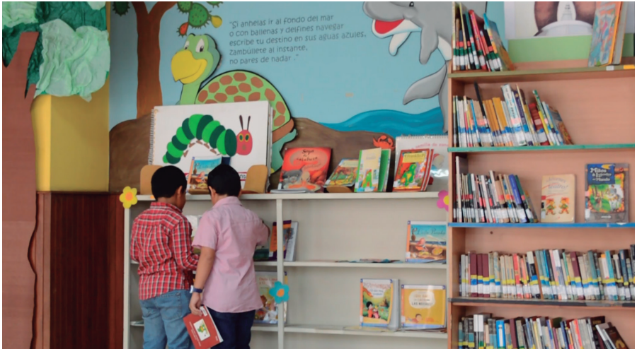
Sala infantil "Ruth Garaicoa Soria" - CCNG