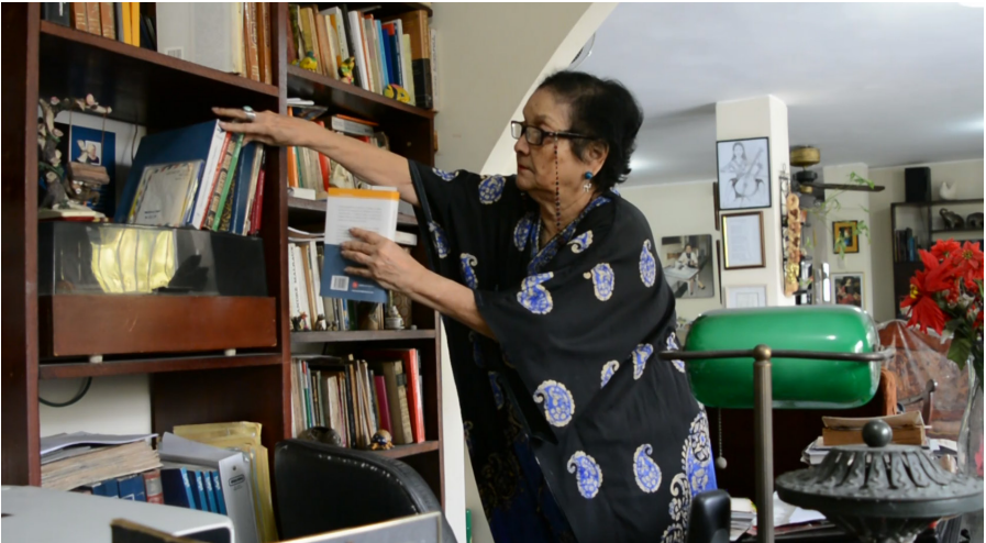
Casa de Piedad Romo-Leroux Biblioteca personal