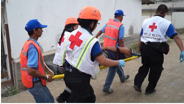
Cooperativa Balerio Estacio Guayaquil