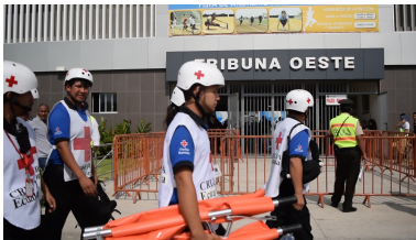
Estadio Cristhian Benítez Parque Samanes Guayaquil