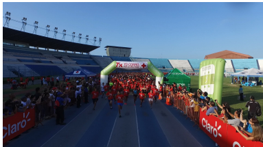
Estadio Alberto Spencer Guayaquil