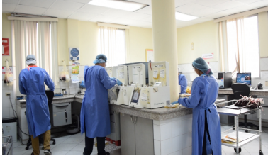
Laboratorio del Banco de Sangre Cruz Roja Ecuatoriana Junta Provincial del Guayas