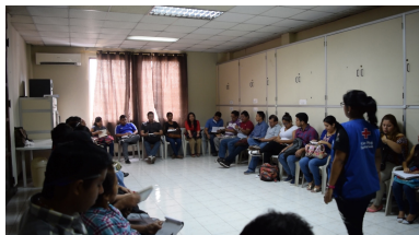
Sala de Capacitaciones Cruz Roja Ecuatoriana Junta Provincial del Guayas