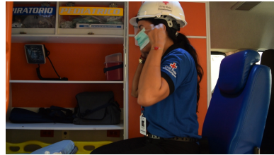
Ambulancia de la Cruz Roja