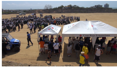
Zona Rural de Playas Villamil Playas