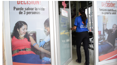
Instalaciones de Donación Voluntaria de Sangre Guayaquil