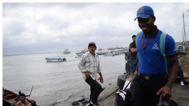
Riveras de la Playa Villamil Playas