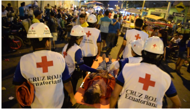
Procesión Divino Niño Durán