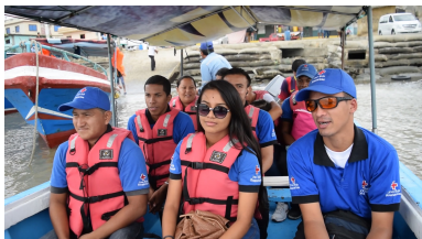
Isla Puná Guayaquil