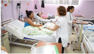
Hospital Materno Infantil Matilde Hidalgo de Procel Guayaquil