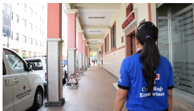
Exteriores de la Cruz Roja Ecuatoriana Junta Provincial del Guayas