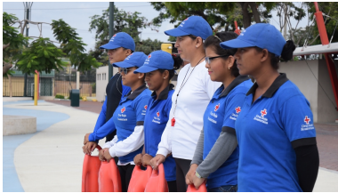
Laguna Artificial del Parque Covien Guayaquil