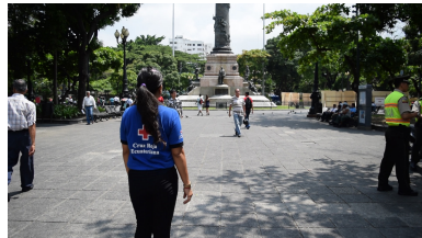
Parque Centenario Guayaquil