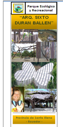
Figura 4. Portada de tríptico promocional al Parque Ecológico y Recreacional “Arq. Sixto Durán Ballén”.

La frecuencia de publicidad estará definida por las etapas de promoción del Parque: inauguración, funcionamiento regular o eventos especiales. La figura 4 presenta la portada de un tríptico promocional, mostrando los diferentes atractivos y experiencias que el visitante puede encontrar en él.