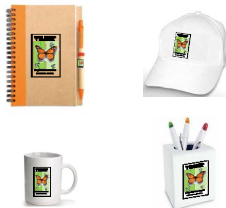
Figura 5. Artículos promocionales del Parque Ecológico y Recreacional “Arq. Sixto Durán Ballén”.

Para difundir los servicios del Parque, durante visitas promocionales a establecimientos y eventos especiales se obsequiará a los clientes artículos pequeños estampados con el logotipo del establecimiento, tales como: libretas de apuntes, bolígrafos, gorras, porta bolígrafos, jarros, calcomanías. En la figura 5 se aprecian algunos de estos artículos promocionales.