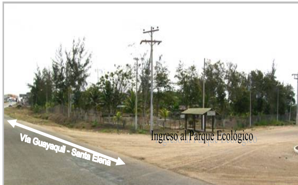
Figura 1. Vista exterior del Parque Ecológico y Recreacional “Arq. Sixto Durán Ballén”.

La figura 1 muestra la vista frontal externa del Parque.