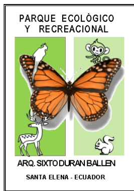
Figura 3. Logotipo al Parque Ecológico y Recreacional “Arq. Sixto Durán Ballén”.

El logotipo forma parte de la creación de identificación e imagen del Parque Ecológico. El diseño se fundamenta en los conceptos principales del establecimiento: la naturaleza, flora, fauna y lepidópteros, el mismo que se presenta en la figura 3.