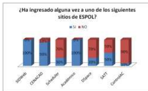
Figura 5.6.2. Servicios de ESPOL (global).

Los servicios de ESPOL más utilizados entre los encuestados son SIDWeb, CENACAD y Académico (ver Figura 5.6.2.). Un fenómeno a esperarse pues estos 3 sistemas son de uso obligatorio en la ESPOL. El siguiente servicio más usado es el SATT 29 (sistema para aprobación de tesis y temarios) orientado para aquellos estudiantes de niveles superiores interesados en empezar sus tesis. A continuación le siguen los servicios DSpace 30 (repositorio de tesis de grado de la ESPOL) para estudiantes graduados, y Scheduler (Sistema de Horario de Clases y Exámenes) para estudiantes de pre-grado. Por último el Sistema ControlAC 31 (control académico) orientado a profesores. De estos 7 servicios que ESPOL brinda a su comunidad, se eligieron 3 para la primera versión de miESPOL: SIDWeb, CENACAD y Scheduler, debido a la gran demanda entre los estudiantes de pre-grado.