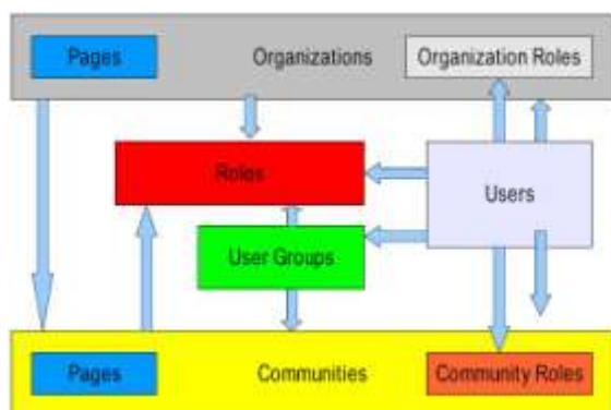
Figura 4.1.1. Estructura portal Liferay.

Aquí se alojará el portal web denominado “miESPOL”, el cual estará basado en el proyecto de código abierto “LIFERAY”, que utiliza tecnologías como Java J2EE/JEE, Hibernate, JSR, AJAX, Webservices, MySQL, Tomcat, entre otros. La arquitectura del Portal es la siguiente: