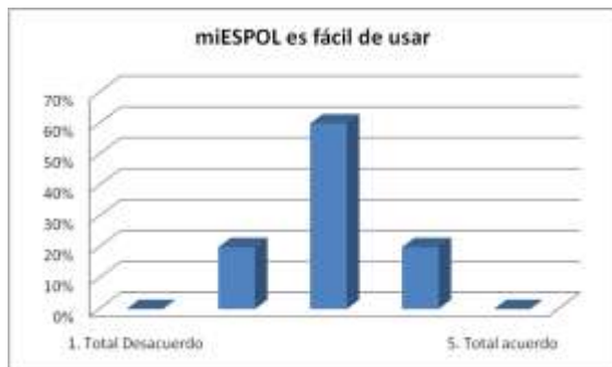
Figura 5.6.4. miESPOL es fácil de usar.

Con respecto a la usabilidad de miESPOL, se encontraron críticas en cuanto a la facilidad de uso del sistema (ver Figura 5.6.4.), pues existen tareas cuyo procedimiento es muy complejo y en algunos casos las instrucciones del sistema no son muy intuitivas para el usuario, lo que acarrea pérdida de tiempo en la ejecución de estas tareas. La mayoría de los encuestados están de acuerdo en que puede llegar a ser fácil aprender a usar miESPOL. No obstante, según las novedades registradas en las pruebas de usabilidad, 3 de las 11 tareas propuestas, fueron las más críticas, por el tiempo requerido para culminar cada tarea y por no ser intuitivo para el usuario. Estas tareas críticas, fueron: Iniciar sesión, Cambiar plantilla de portal y Crear nuevo contenido web. Esta última fue la tarea más complicada para los usuarios por la complejidad en el manejo de imágenes, registrando un tiempo promedio de 3 minutos con 43 segundos, habiendo cometido 3,56 errores en promedio antes de culminar la tarea. Solo el 20% de los usuarios que realizaron la prueba #8A consideraron intuitiva la tarea.