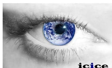
Figura 1. Logo del ICICE.

Al realizar el logo se pensó, en cómo se quería representar a la empresa en un gráfico y se nos ocurrió fusionar dos elementos que fueron: El ojo humano y el mundo. Estos elementos fusionados nos dan el mensaje de tener una perspectiva mundial, al alcance de nuestra vista. Y en cuanto a los colores, se usaron: el azul oscuro que es el color de la tecnología y que también inspira confianza; el negro que es un