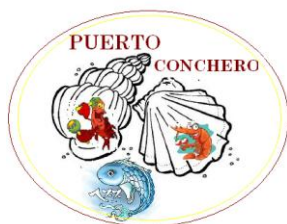
Figura 6. Logo y slogan del destino

Para este procedimiento, se han creado una marca y slogan que identificarán al recinto Puerto Conchero, como un destino de pesca vivencial.