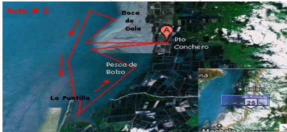
Figura 2. Recorrido de la ruta 2

Recorrido: Salida desde el muelle de Puerto Conchero. En sentido norte se navegará hasta el sector Boca del Gala, lugar de observación de aves. En sentido sur hasta La Puntilla, para observar diversas artes de pesca cercanas a las orillas (recolección de mariscos con bolsos, comederos, etc.)