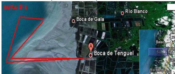
Figura 1. Ruta Observación de aves

Recorrido: Salida desde el muelle de Puerto Conchero, y observación del paisaje y fauna en la Boca del Gala (hacia el norte)