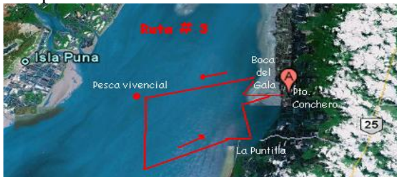
Figura 3. Recorrido de la ruta 3

Recorrido: Salida desde el muelle de Puerto Conchero. En sentido norte se navegará hasta el sector de la Boca del Gala. Luego mar adentro (con dirección sur-oeste) observación de las artes y jornada de pesca vivencial.