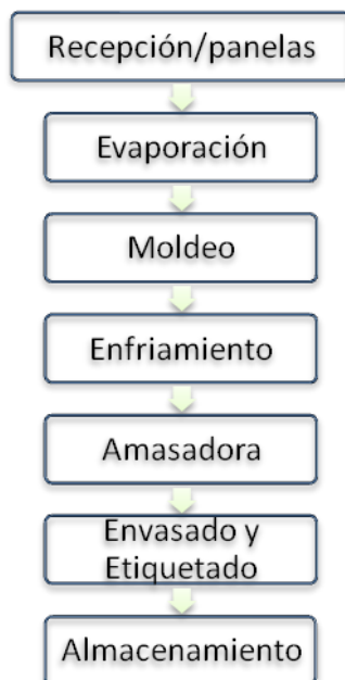
Figura 1. Procesos de elaboración