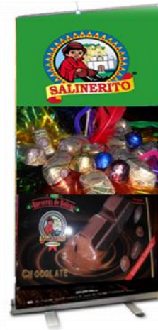
Figura 2. Banner publicitario