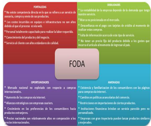
Figura 4. FODA