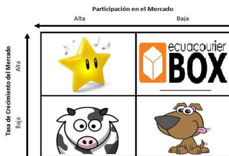
Figura 5. Matriz BCG

Se basa en la teoría del ciclo de vida del producto, en nuestro caso del servicio. Al ser una empresa nueva la cual recién va a iniciar sus actividades entraremos al mercado como un servicio INTERROGANTE ya que no tendremos la certeza del grado de aceptación que tendremos por parte del target al cual nos vamos a dirigir por ese motivo nos tocara invertir fuertemente.