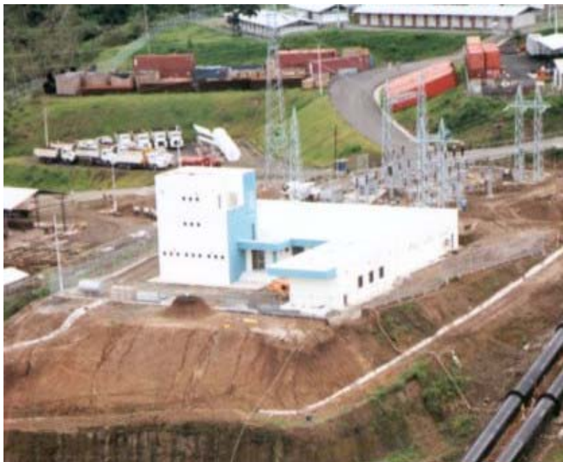
Gráfico 1.1 Subestación Severino

Para la operación de la Estación de Severino se requiere una capacidad instalada de 20 MW la cual se proyecta suplir mediante una línea de transmisión a 138 kv que deberá interconectar Severino con la Central Marcel Laniado y la Subestación Chone. En el gráfico 1.1 se aprecian la situación actual de la subestación Severino a 138 Kv .