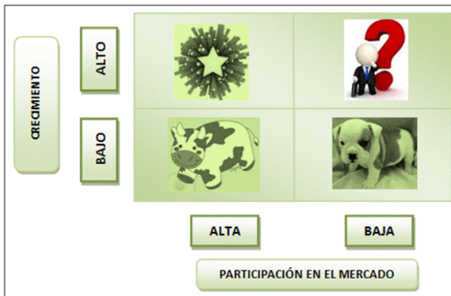
Figura: Matriz BCG