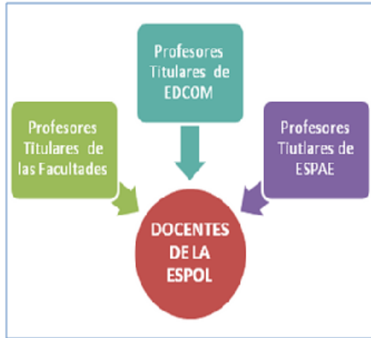
Figura 4: Docentes incluidos en la segunda etapa

Para la segunda etapa del plan de implementación de Firma Electrónica en la ESPOL, se tiene considerado incluir al personal docente de la ESPOL (ver Figura 4), para esto solo se tendrá en cuenta los profesores e investigadores titulares de la ESPOL (titular principal, titular agregado, titular auxiliar).