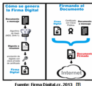
Figura 1: Creación de la Firma Electrónica