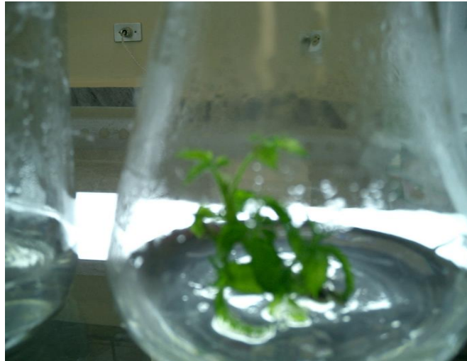
FIGURA 1.5 VITROPLANTAS A LOS 90 DÍAS

En la Tabla 6. Promedio de longitud de brotes en cm, registrado a los 90 días de la siembra in vitro de Mora tropicalizada ( Rubus brasus ), podemos observar que los tratamientos T1 , T2 , T3 , y T4 son estadísticamente diferentes entre sí al nivel del 1% de probabilidades de acuerdo a la prueba de Tukey. El coeficiente de variación calculado fue del 14,04 %.