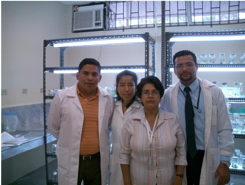
Fig. 7 Vista interior del Laboratorio de Biotecnología FIMCP-ESPOL y personal de apoyo de la investigación