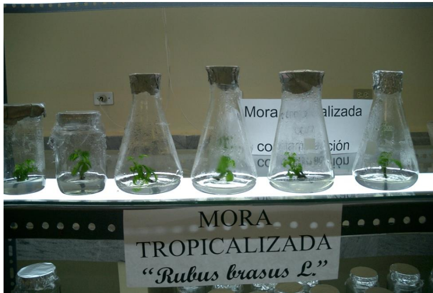
Fig. 2 Explante con yemas inducidas