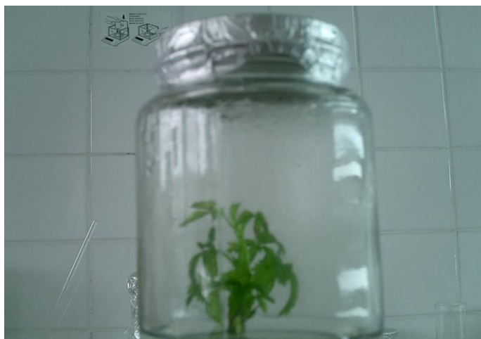
FIGURA 1.4 VITROPLANTAS A LOS 60 DIAS

En la Tabla 5. Promedio de longitud de brotes en cm, registrado a los 60 días de la siembra in vitro de Mora tropicalizada ( Rubus brasus ), podemos observar que los tratamientos T1, T2, T3, y T4 son