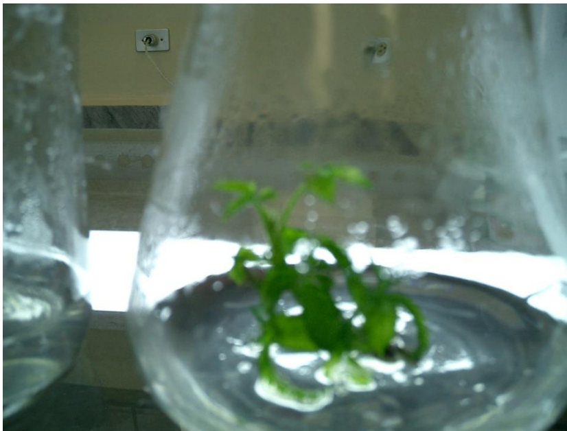
Fig. 5 y 6 Vitroplanta en un medio de cultivo T4 (MS + 0.50 mg/l de BAP + 0.10 mg/l de AIA + 0.25 mg/l de G3)