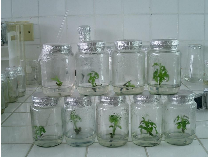
Fig. 3 Vitroplantas en un medio de cultivo de desarrollo caulinar y radicular