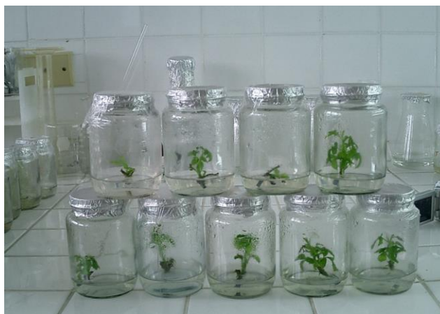
FIGURA 1.2 EXPLANTES A LOS 60 DÍAS

En la Tabla 2 el Promedio de número de brotes, registrado a los 60 días de la siembra in vitro de Mora tropicalizada ( Rubus brasus ), podemos observar que los tratamientos T1, T2, T3, y T4 son estadísticamente diferentes entre sí al nivel del 1% de probabilidades de acuerdo a la prueba de Tukey.