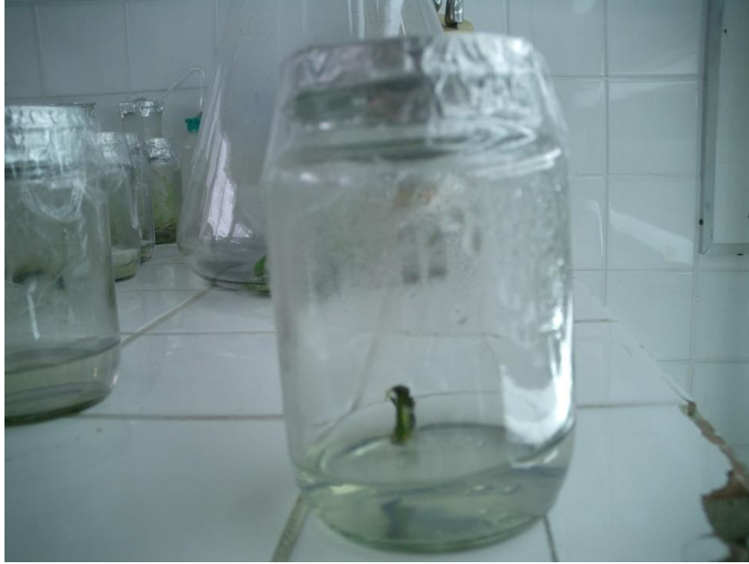
Fig. 1 Micro estaca en medio de inicio