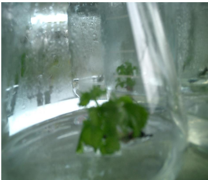
FIGURA 1.3 VITROPLANTAS A LOS 90 DIAS

En la Tabla 3, el promedio de número de brotes, registrado a los 90 días de la siembra in vitro de Mora tropicalizada ( Rubus brasus ), podemos observar que los tratamientos T1 , T2 , T3 , y T4 son estadísticamente diferentes entre sí al nivel del 1% de probabilidades de acuerdo a la prueba de Tukey. El coeficiente de variación calculado fue del 16,29 %.