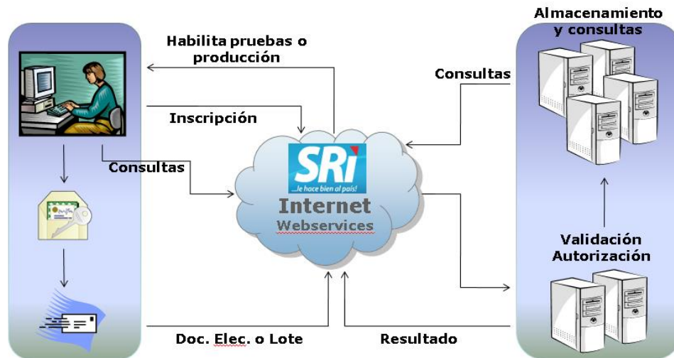
Figura 2.1 Esquema de emisión de documentos electrónicos (gráfico facilitado desde página SRI) [2].