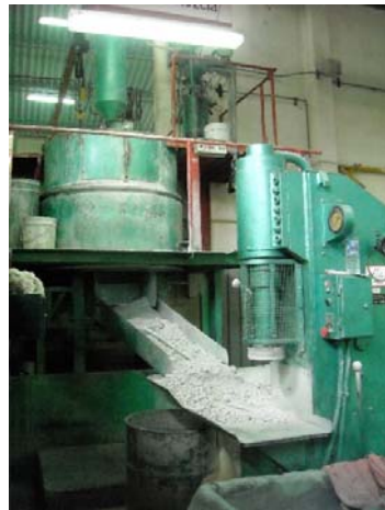
Fig. 1.2 Mezcladora y prensa de briquetas [4]

la cual posee un par de ruedas y raspadores que realizan el proceso en seco durante 5 a 7 minutos. En el proceso “mezcla húmeda”, se introducen los silicatos desde una tolva, donde cae por gravedad hacia el interior de la mezcladora, para formar una mezcla pastosa, la cual es procesada durante aproximadamente 20 minutos. En el “briquetado”, la masa pastosa resultante del proceso anterior, es bajada de la mezcladora por una compuerta que conduce a un plano inclinado, el cual lleva hacia una prensa de briquetas, donde se procede a compactar la masa, dándole una forma cilíndrica llamadas “briquetas”.