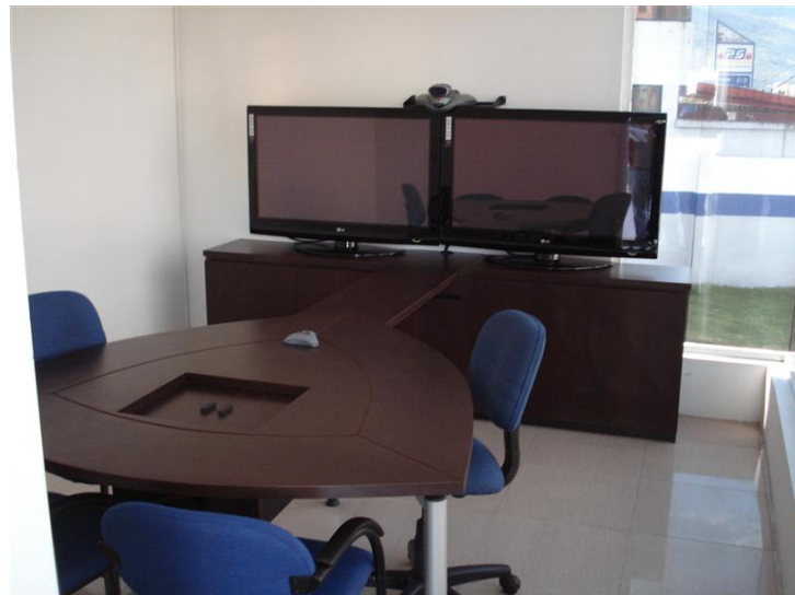
Figura 2.3: Sala de Videoconferencia Ambato