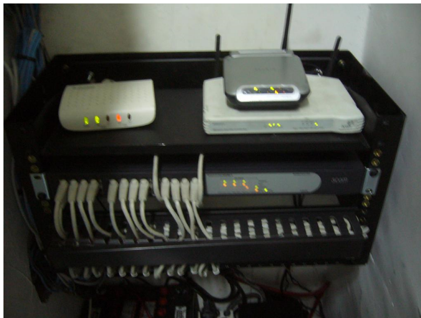
Figura 2.1 Organización de Rack en Agencia Ambato

A continuación imágenes de implementación de algunas soluciones