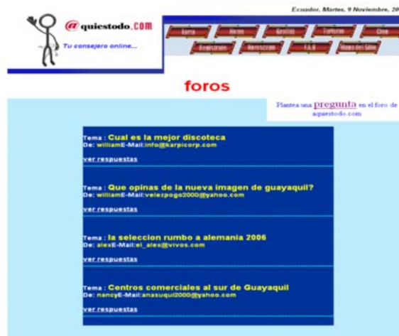
Fig. 3 Pantalla de “Foros”

Dentro de esta opción los usuarios podrán intercambiar ideas sobre diferentes temas en relación a la temática de la página.