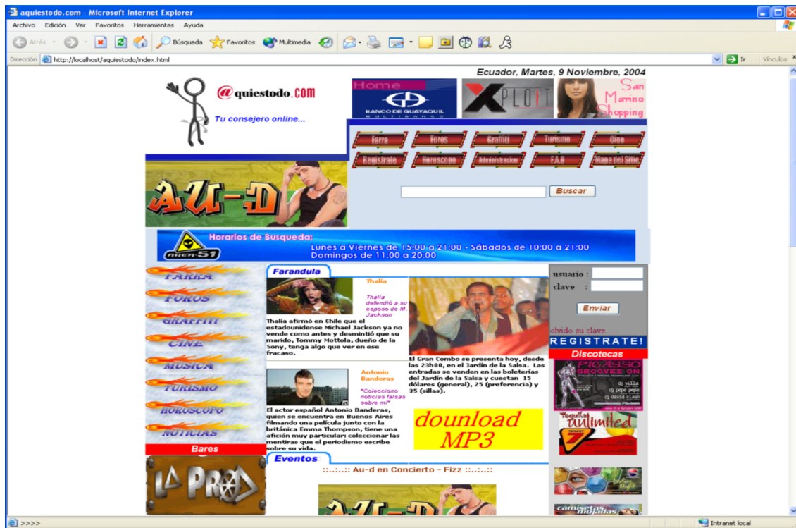
Fig. 1 Pantalla de Principal

En forma resumida presentamos cuales son las funciones principales del Sitio Web de CONSEJERO, ya que este fue desarrollado con la finalidad de informar al usuario todas las facilidades en las opciones que el escoja, entre ellas tenemos las siguientes opciones: