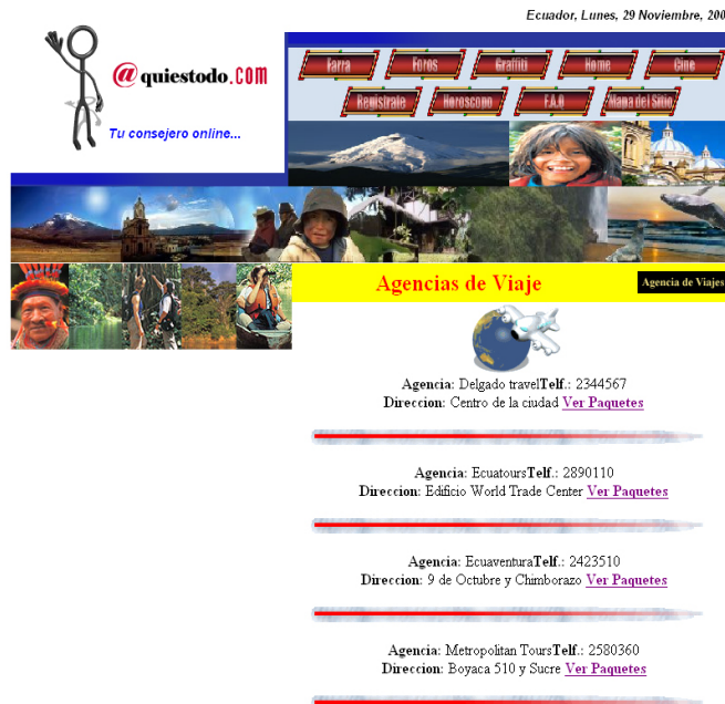
Fig. 6 Pantalla de “Turismo”

Dentro de esta opción los usuarios podrán encontrar información sobre diferentes agencias de viaje, los paquetes turísticos que ofrecen, con los precios y enterarse de los lugares turísticos que ofrece nuestro país.