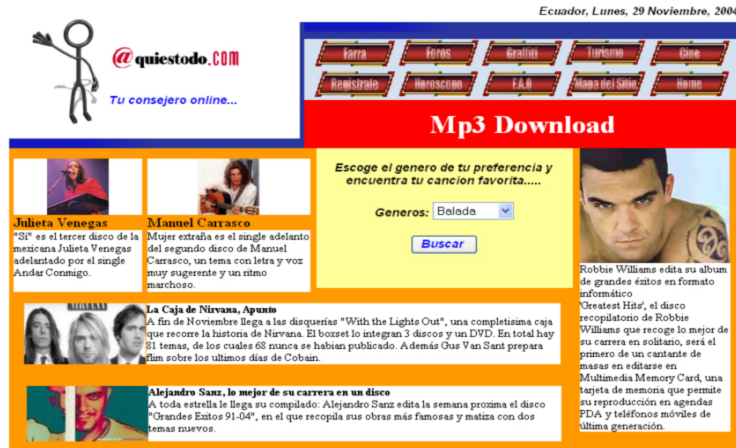
Fig. 10 Pantalla de “Música”

Dentro de esta opción los usuarios tendrán la posibilidad de descargar la canción de su preferencia y guardarla en su computador.