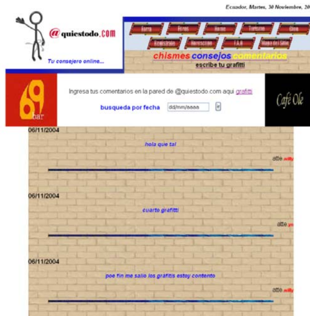
Fig. 4 Pantalla de “Graffiti”

Dentro de esta opción los usuarios podrán dejar un mensaje para que luego de ser revisado por el webmaster del sitio sea publicado en la pared de la página.