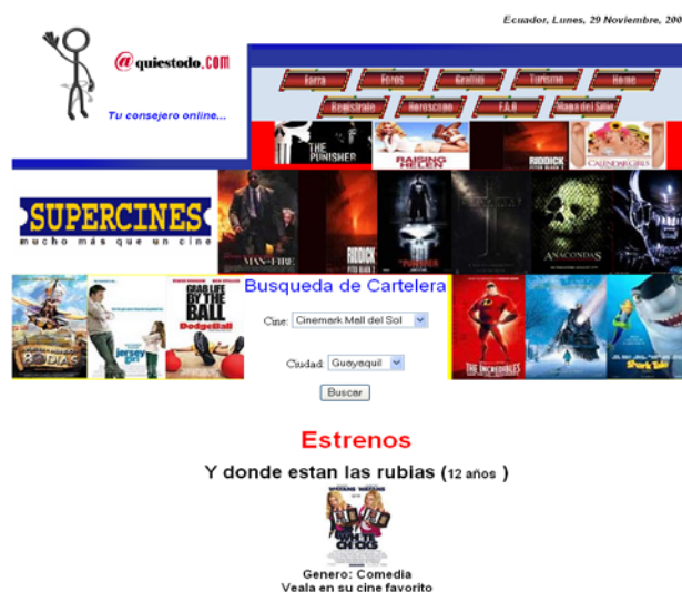
Fig. 7 Pantalla de “Cine”

Dentro de esta opción los usuarios podrán enterarse que las películas de estreno que hay y podrán realizar su búsqueda por el cine favorito en la ciudad que se encuentren y ver su cartelera con los horarios y el precio.