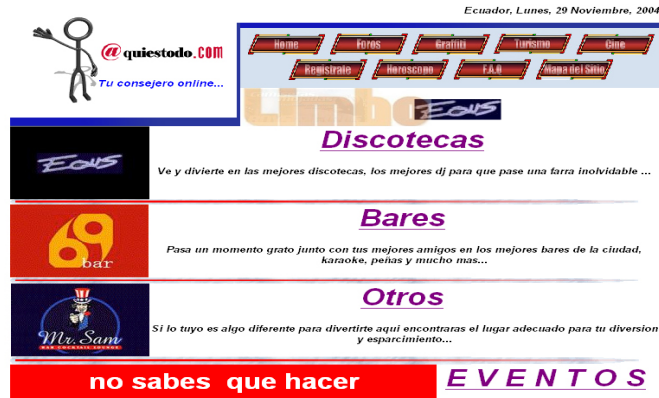
Fig. 2 Pantalla de “Farra”

Dentro de esta opción el usuario podrá conocer las últimas fiestas que realizan las diferentes discotecas, bares, entre otros centros nocturnos que tenemos en nuestro país.