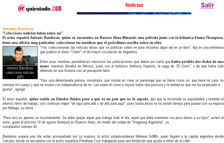
Fig. 11 Pantalla de “Noticias”

Dentro de esta opción los usuarios podrán enterarse sobre lo último de la farándula.