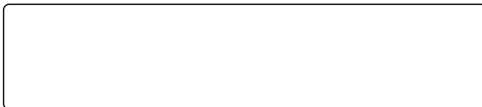
Gráfica de dos sujetos en un plató (posición de cámaras)