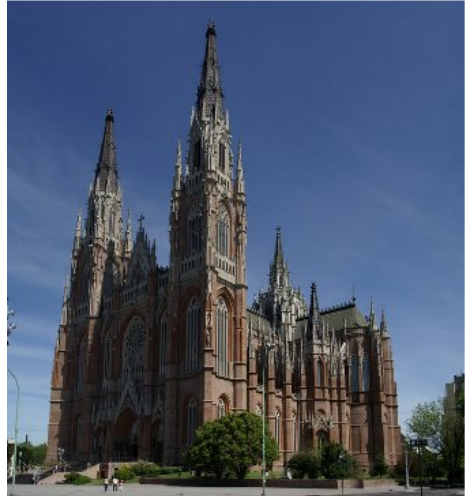
Catedral de Colonia, Alemania.