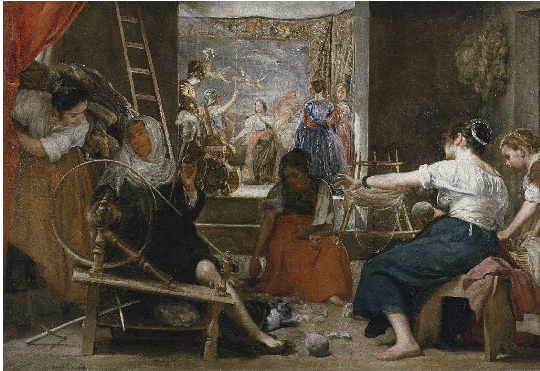
Las Hilanderas, Velásquez, Arte Barroco (s. XVII)

Cuenta Ovidio en Las Metamorfosis, que Aracne fue una gran tejedora mortal hija de un tintorero, que se alardeó de ser más habilidosa que Minerva, diosa de la artesanía. La diosa, ofendida, organizó un concurso entre las dos en la que participó como anciana y no pudo superar a Aracne. A pesar de ello, Minerva la castigó transformándola en una araña, porque el tema elegido por Aracne, los amores de los dioses, era considerado ofensivo. A Aracne se le atribuye el descubrimiento del hilo y las redes, y a su hijo del huso. (Adaptación Libro VI, versos 1-145)