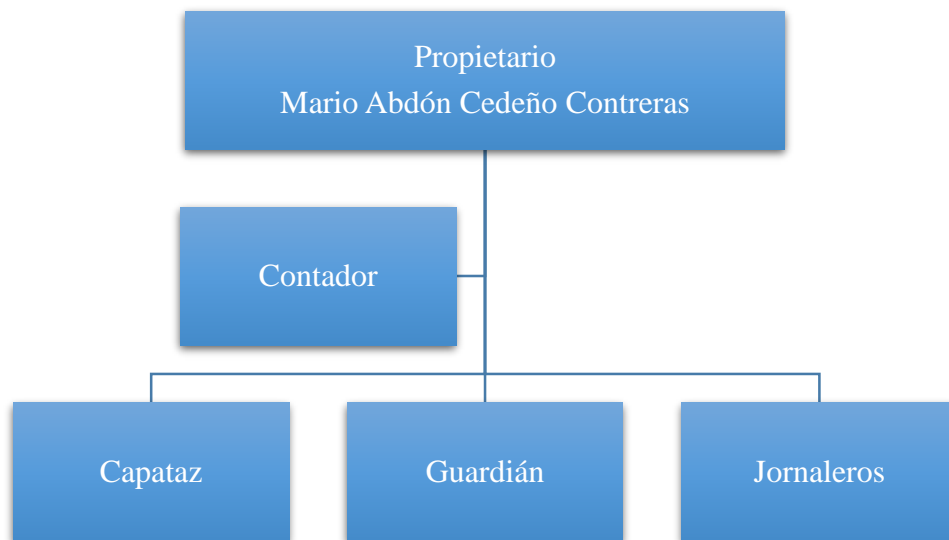
Figura 1 Organigrama