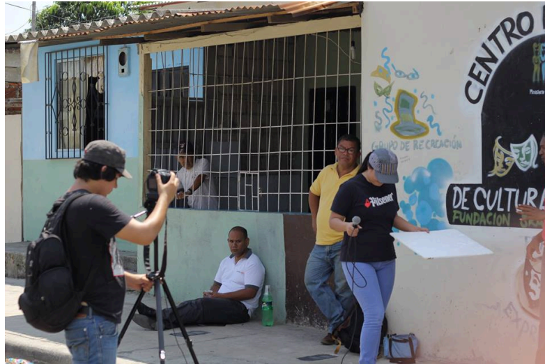
Figura 2 Filmación en la Isla Trinitaria.