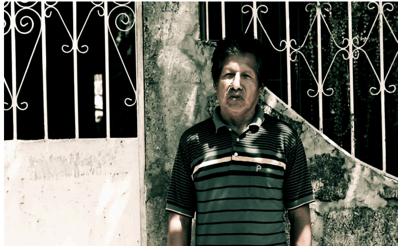
Figura 1: Presentación de Personajes

Presentación de personajes: Después de la toma general del sector o barrio, se presentará a los personajes que estarán en el programa. Cada presentación se realizará bajo un formato específico, donde revelará su nombre, a qué se dedican y alguna información de relevancia que aporte al conocimiento de su diario vivir.