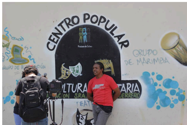
Figura 3 Centro cultural comunitario