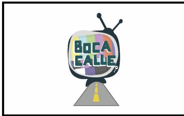
Figura 14: Logo BocaCalle