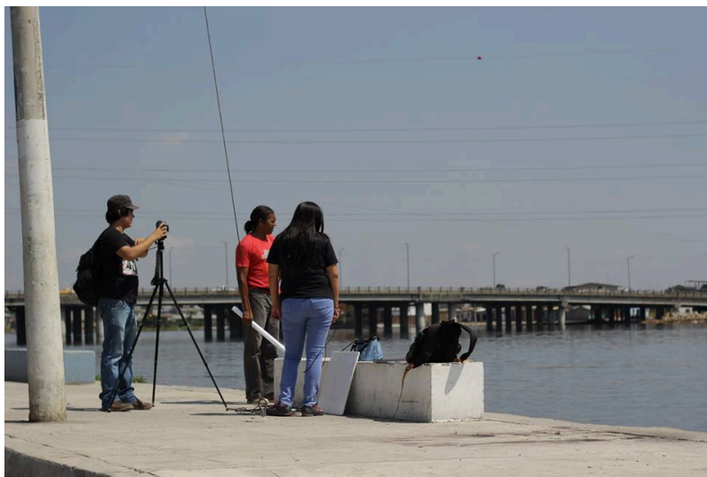
Figura 5: Equipo de trabajo en Malecón Trinitaria.