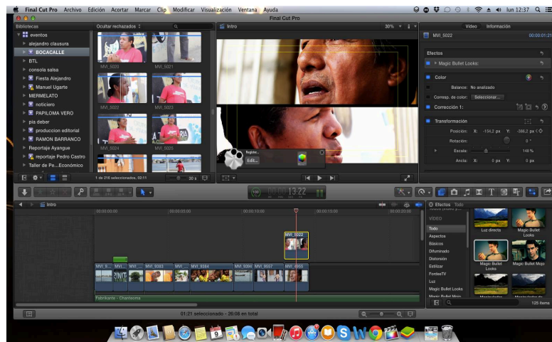
Figura 13: TimeLine

El tratamiento del color, que se aplica en la edición del programa, se mantiene bajo colores cálidos. Mediante la aplicación de este efecto, se pretende representar el clima tórrido de la urbe porteña, lugar donde se desenvuelven los programas. La finalidad de esto, es crear una característica representativa del programa.