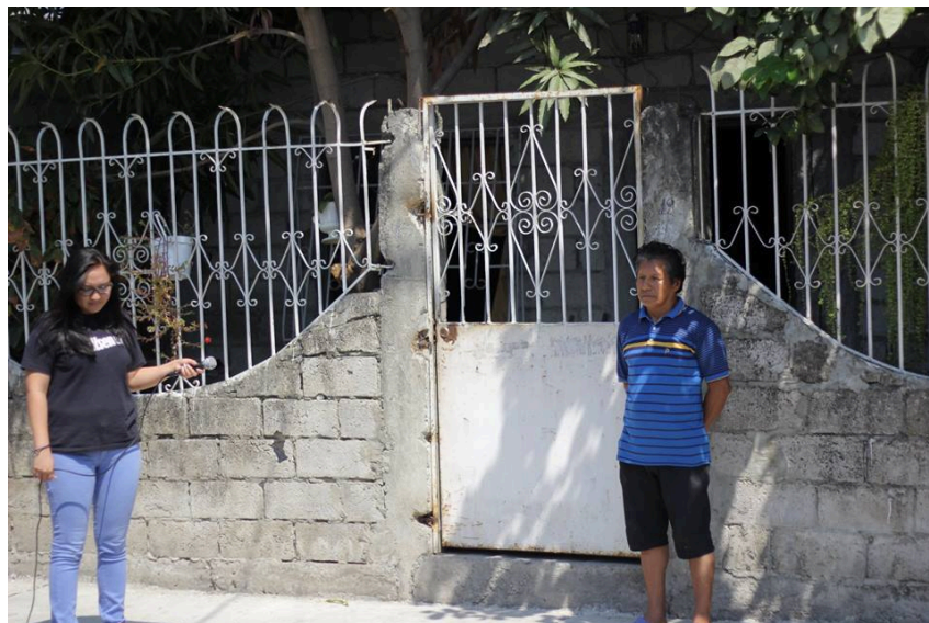
Figura 9: Entrevista. Plano General.