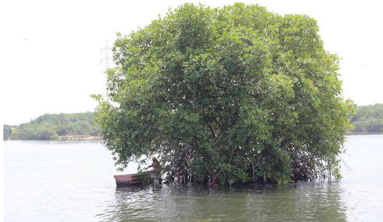
Figura 4: Locaciones