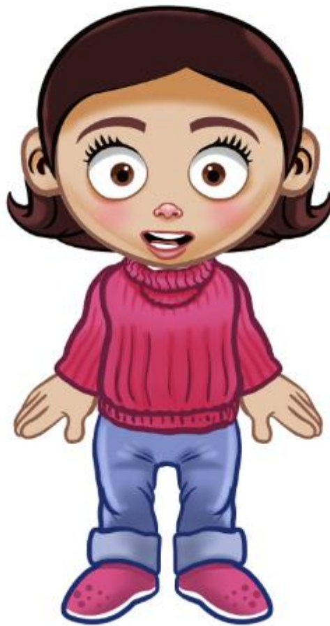
Ilustración 1: Selva Ver.0

El personaje para este primer capítulo se llama Selva, y es una niña de aproximadamente 9 años, mestiza de cabellos y ojos marrones que siempre viste de modo cómodo y relajado con colores intensos llenos de vida. Ella es poseedora de un carácter fuerte, curiosa y entusiasta, constantemente informa al descubrir hechos, a la vez que nos propone soluciones para el cuidado de la tierra.