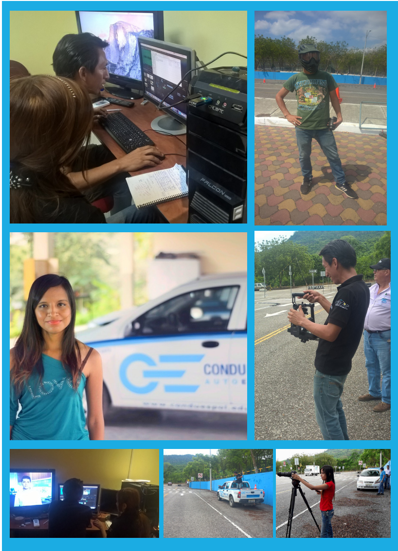
Tema: Cápsulas informativas sobre los tipos de licencias que ofrece Conduespól.