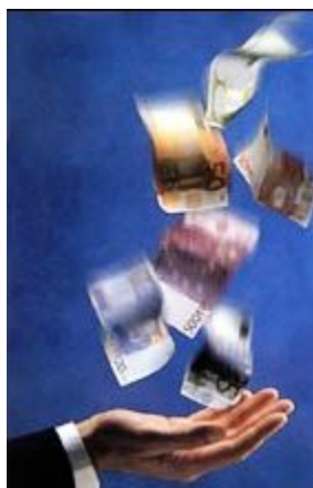
Figura 1.2 Programa de Cultura Tributaria

El Ministerio de Educación, declaró el 28 de Abril de cada año, el Día Nacional de la Cultura Tributaria. Sin tributación no hay derecho; sin impuestos no existe libertad de mercados ni de propiedad privada, habría esclavitud.