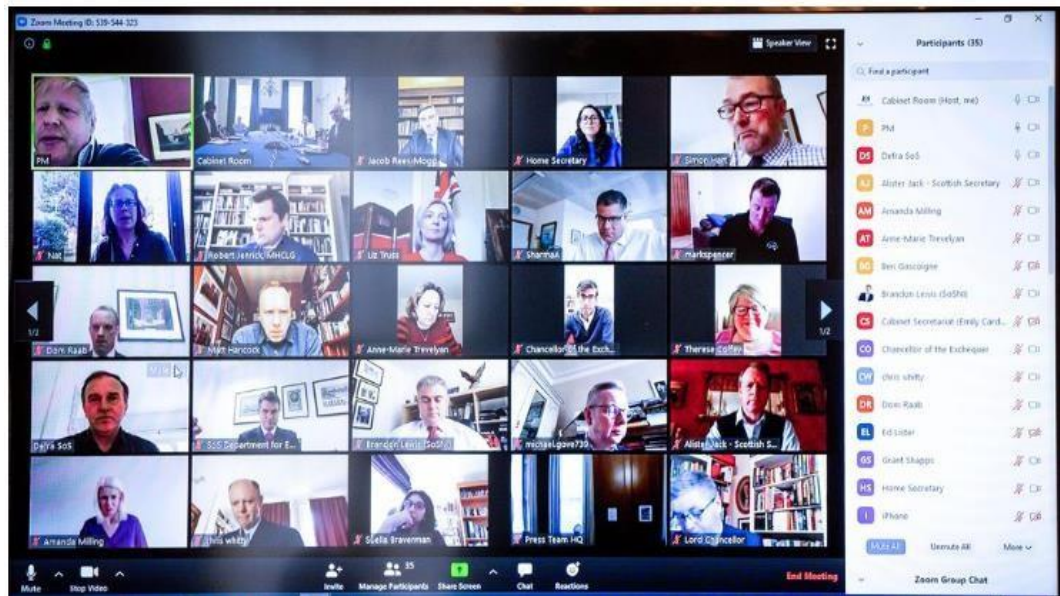
Figura 3.1 Sesión zoom

Pero de lo más relevante de zoom es la capacidad de permitir grabar las sesiones mientras se imparte la cátedra, adicional el poder compartir pantalla mientras, se explora otra opción de mientras se está en la capacitación.