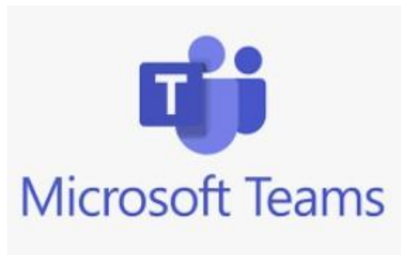
Figura 2.3 Microsoft Teams

Microsoft Teams es una aplicación de videoconferencia por colaboración creada por microsoft para el trabajo colaborativo y de esta manera estén informados, organizados y conectados, todo en un solo lugar a través de una sesión [3].