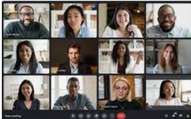
Figura 2.2 meet