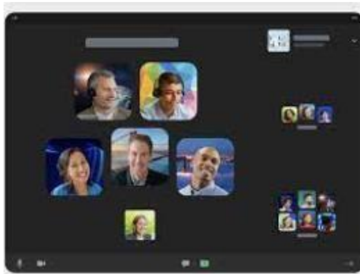
Figura 2.1 ZOOM