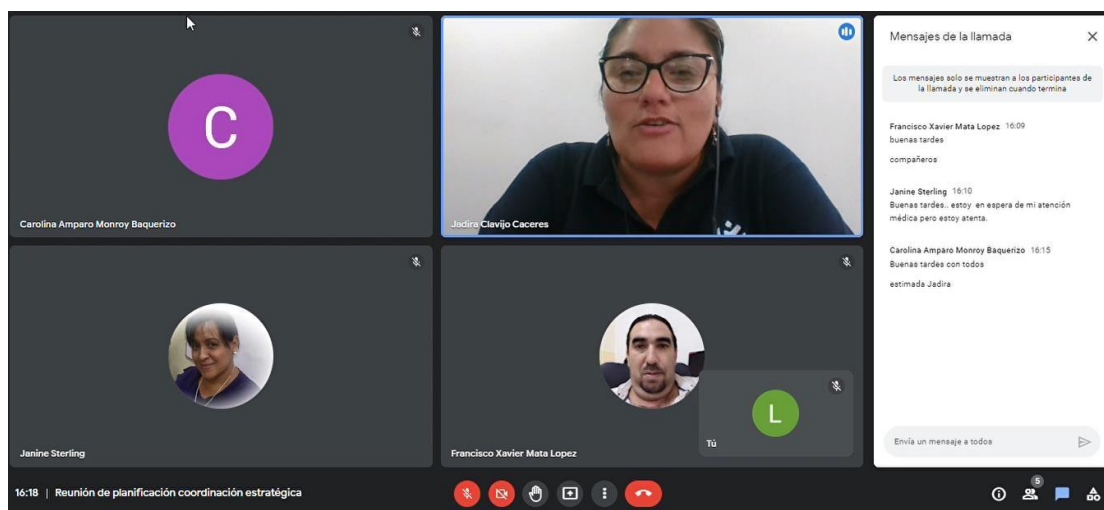
Figura 3.2 Sesión Meet

El uso de meet es bastante bueno sin embargo está limitado a ciertas interacciones al momento de las sesiones, además de no permitir el grabar una sesión de videoconferencia.