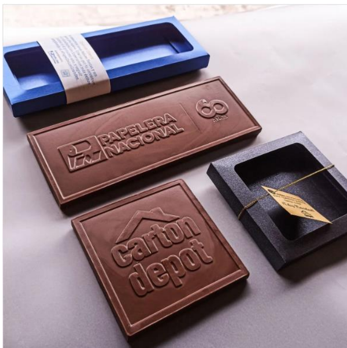
Tabla 8. Presentación personalizada