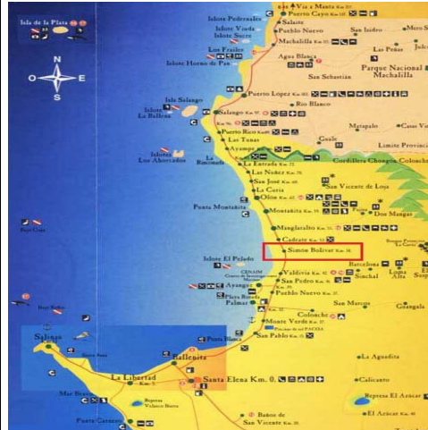
Imagen # 1.- Límites y ubicación Libertador Bolívar

El cantón Santa Elena limita al Norte con la Provincia de Manabí, al Este y Sur con la Provincia del y al Oeste con el Océano Pacífico. Libertador Bolívar limita al Norte con la comuna de San Antonio, al Sur con la comuna Valdivia, al este con la comuna Sitio Nuevo y al oeste con el Océano Pacífico.