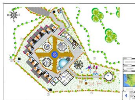
Imagen # 3.- Plano de “El Libertador Ecolodge & Spa”