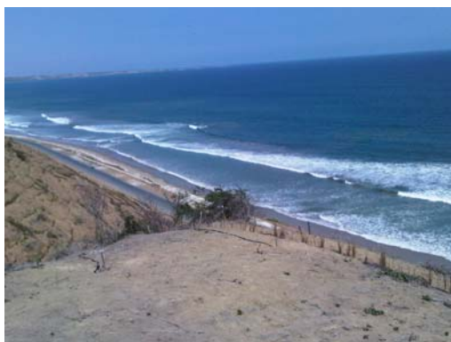
Imagen # 2.- Terreno de “El Libertador Ecolodge & Spa”

De acuerdo con las características de hospedaje y recreación planificadas para “El Libertador Ecolodge & Spa” se ha considerado necesario contar con un terreno de superficie total de 5.670 m 2 .